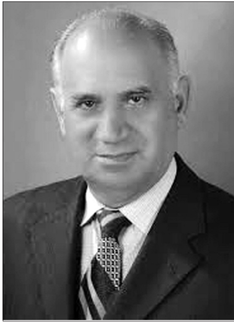
siyyətin formalaşması" mövzusunda doktorluq dissertasiyası müdafiə etmişdir. 1974-1981-ci illərdə "Azərbaycan məktəbi" jurnalının və