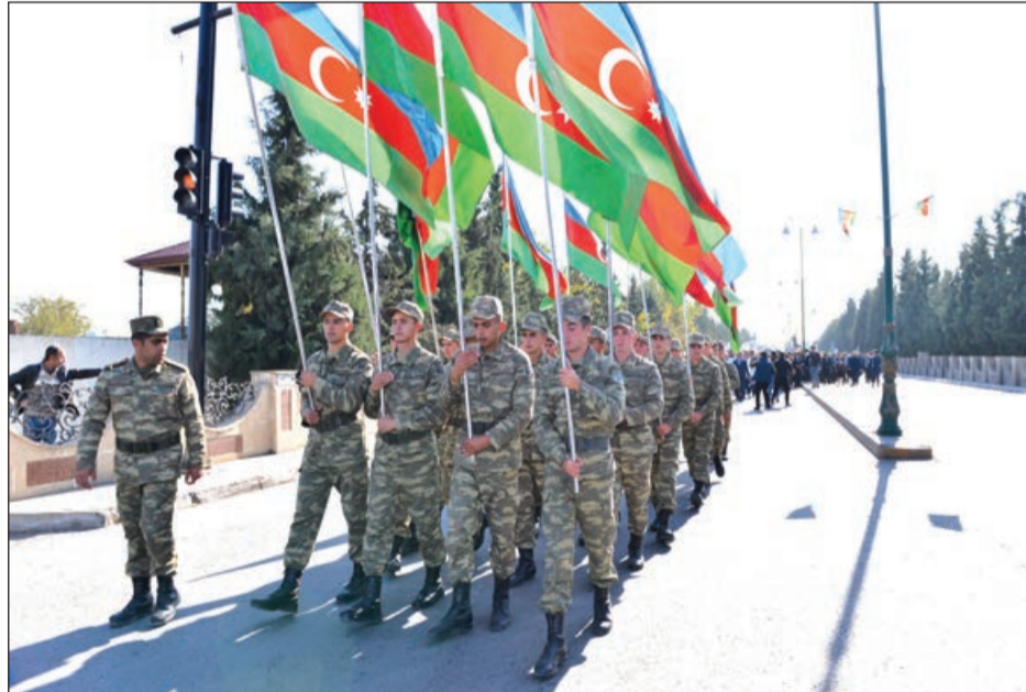
Əvvəlki 1-ci səh.

Ağdamda keçirilən "Bayraq yürüşü"ndə minlərlə rayon sakini iştirak etmişdir