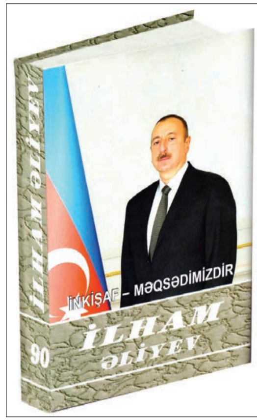
Azərbaycanda bütün fundamental azadlıqlar təmin edilib, o cümlədən söz azadlığı, sərbəst toplaşma azadlığı, mətbuat azadlığı, vicdan azadlığı.

ğımız bizim qürur mənbəyimizdir, bayrağımız bizim canımızdır və ürəyimizdir. Bu gün Azərbaycanın hər yerində dövlət bayrağı dalğalanır. Azərbaycanın ərazi bütövlüyünü bərpa edəndən sonra milli dövlət bayrağımız hələ də işğal altında olan torpaqlarda qaldırılacaq. Bizim bayrağımız Dağlıq Qarabağda, Xankəndidə, Şuşada dalğalanacaq. O günü biz hər an öz işimizlə yaxınlaşdırmalıyıq və yaxınlaşdırmaq kimi duyğusal fikirlər hər bir azərbaycanlının və bütün soydaşlarımızın qəlbinə riqqətə gətirmişdir. Dövlət rəmzlərinə, xüsusən də bayrağımıza Azərbaycanı həmişə müqəddəs atıribut kimi yanaşmışdır. 2010-cu ildən başlayaraq Milli Bayraq Günüünün ayrıca bayram kimi qeyd edilməsi ölkə başçısının və vətəndaşlarımızın öz dövlətçiliyinə və suverenliyinə, dövlət rəmzlərinə və müstəqillik simvollarına yüksək münasibətinin əyani təzahürüdür. İnsanlarımız Milli Bayraq Günüünü millətimiz, xalqımızın azadlıq və istiqlal ideallarının, milli varlığının, bəşər sivilizasiyasında özünəməxsus milli-mənəvi dəyərlərə malik olmasının təccəssümü kimi dəyərləndirir, bayrağımızı ölkəmizin ərazi bütövlüyü və suverenliyinin, dünya azərbaycanlılarının mənəvi birliyinin, doğma vətənlə vahidliyinin simvolu kimi qəbul edirlər.