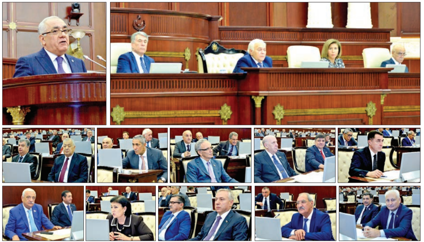
Əvvəlki 1-ci səh.