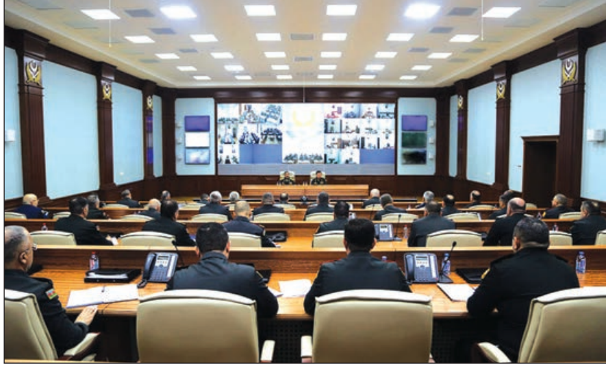
Müdafiə naziri keçiriləcək komanda-qərargah hərbi oyunlarında əsas diqqətin ən yeni, o cümlədən kosmik texnologiyaların tətbiqi ilə qoşunların

Azərbaycan Respublikasının Prezidenti, Ali Baş Komandan İlham Əliyevin Azərbaycan Ordusu qarşısında qoyduğu tapşırıqları rəhbər heyətə çatdıran nazir bundan irəli gələn məsələlərin qoşunlarda vaxtında və daha keyfiyyətlili icrasını təmin etmək barədə konkret göstəriş verib.