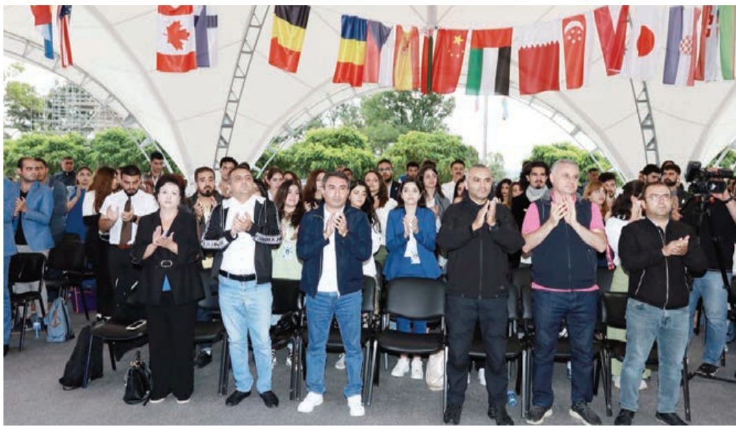
ilmiş intellektual oyunların qalibləri mükafatlandırılıb. Eyni zamanda düşərgədə xüsusi fəallıq göstərən gənclər püşkatmada iştirak edərək hədiyyələr qazanıblar. Qeyd edək ki, Diaspor Gənclərinin III Yay Düşərgəsi

Sonra düşərgə iştirakçılarına sertifikatlar təqdim olunub, layihə çərçivəsində keçir-