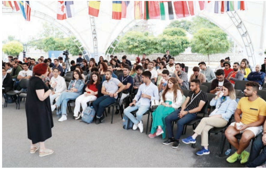
mə prosesinin müxtəlif istiqamətləri barədə tövsiyələr səsləndirilib. Sonra panel iştirakçılarında Dövlət Komitəsinin diaspor gəncləri ilə bağlı

Diaspor sahəsində şəbəkələşmənin mühüm amil olduğunu vurğulayan çıxışçılar bildiriblər ki, düşərgə iştirakçılarının bu prosedə fəal iştirakı, tarixi vətənlərini yaşadıkları ölkələrdə yüksək səviyyədə təmsil etmələri böyük əhəmiyyət kəsb edir. Şəbəkələş-