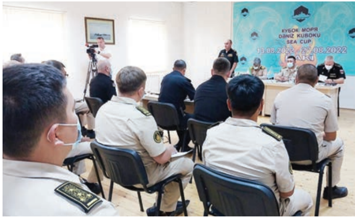
İştirakçı dövlətlərin nümayəndələrinin qatıldığı tədbirdə təşkilatçı məsələlərə bağlı tərəflərin təklifləri dinlənilib.

Bu barədə AZƏRTAC-a Müdafə Nazirliyinin Mətbuat xidmətindən məlumat verilib.