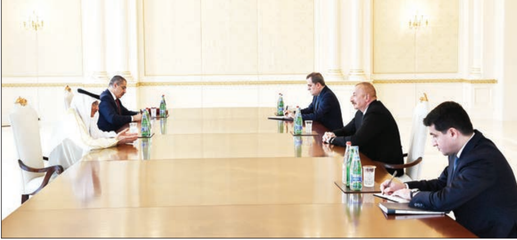
Əvvəli 1-ci səh.

İndi biz bütün dünyanın bunu görməyini, başa düşməyini istəyirik ki, bizim atdığımız addımlar haqq işi idi, beynəlxalq hüquqa, BMT-nin Nizamnamasına, özünümüdfə hüququmıza və ədalətə əsaslanırdı. Biz ədaləti bərpə etdik. Təvəzükar bizim torpaqlarımızdan qovuldu və indi bərpə vaxtıdır. Lakin bu, vaxt aparacaq. Çünki əlbəttə ki, ən böyük problem minalardır. Mühərribə bitənə sonra bizdə artıq onlarla itki olub, o cümlədən minalardan önlər olub. Eriməstan bizə minaların xərəsinə verməyib. Bu, daha bir mühərribə cinayətdir. Çünki bunu etmək onların borcudur. Lakin mühərribənin artıq aylardır bitməsinə baxmayaraq, onlar azərbaycanlılara qarşı bu siyasəti davam etdirirlər. Lakin biz lazım olan hər şeyi edəcəyik. Minatərləmə prosesini gedir. Biz artıq yenidən-qurma işlərini planlaşdırırıq.