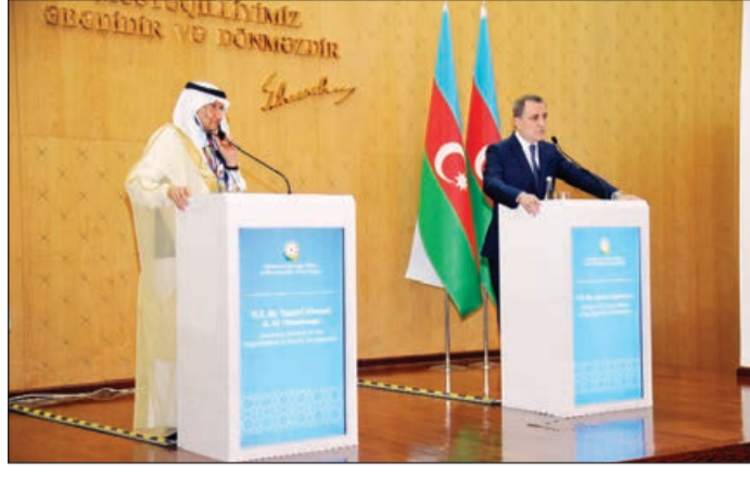
Əvvəli 1-ci səh.

Ötuz il ərzində Ermənistan işğal etdiyi əraziləri minalayaraq istifadəsiz hala gətirib və bu ərazilərin xəritəsini Azərbaycanca vermək istəmir. Bütün aidiyyəti qurumlara bu barədə sənədlər, hesabatlar təqdim edilib. Son günlər ərzində vətəndaş cəmiyyətinin üzvləri tərəfindən də bununla bağlı pətişiya ha-