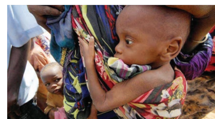
BMT-nin bu regionda çalışan əməkdaşları insanların aqlaşığız əzab-əziyyətləri, o cümlədən aclıqdan ölmə hallarının artdığını bildirirlər.

Tıqrayda bütün humanitar tələbatı təmin etmək üçün oraya hər gün ərzaqla, ən zəruri əşyalarla və yanacaqqla dolu 100 yük maşını daxil edilməlidir.