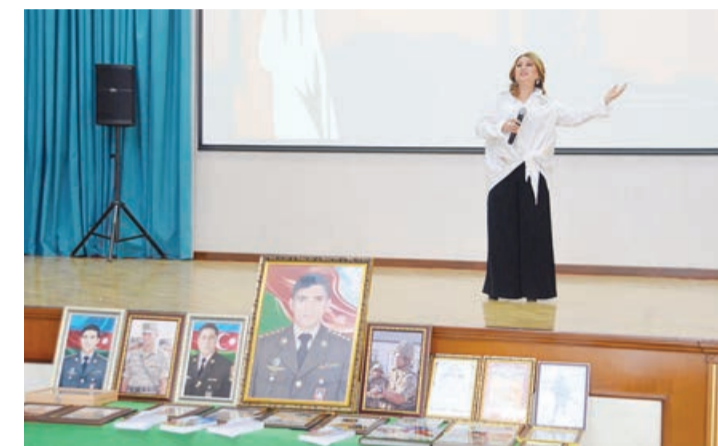
çarx təqdim edilib. Təqdimat mərasimində çıxış edənlər bu kitabın gələcək nəsillər üçün dəyərli bir vasitə olacağını vurğulayıblar.

sükutla yad edilib, Azərbaycan Respublikasının Dövlət Himni ifa olunub. Sonra 44 günlük Vətən müharibəsindən, şəhid kapitan Həmid Cəfərinin həyat və döyüş yolunda bəhs edən video-