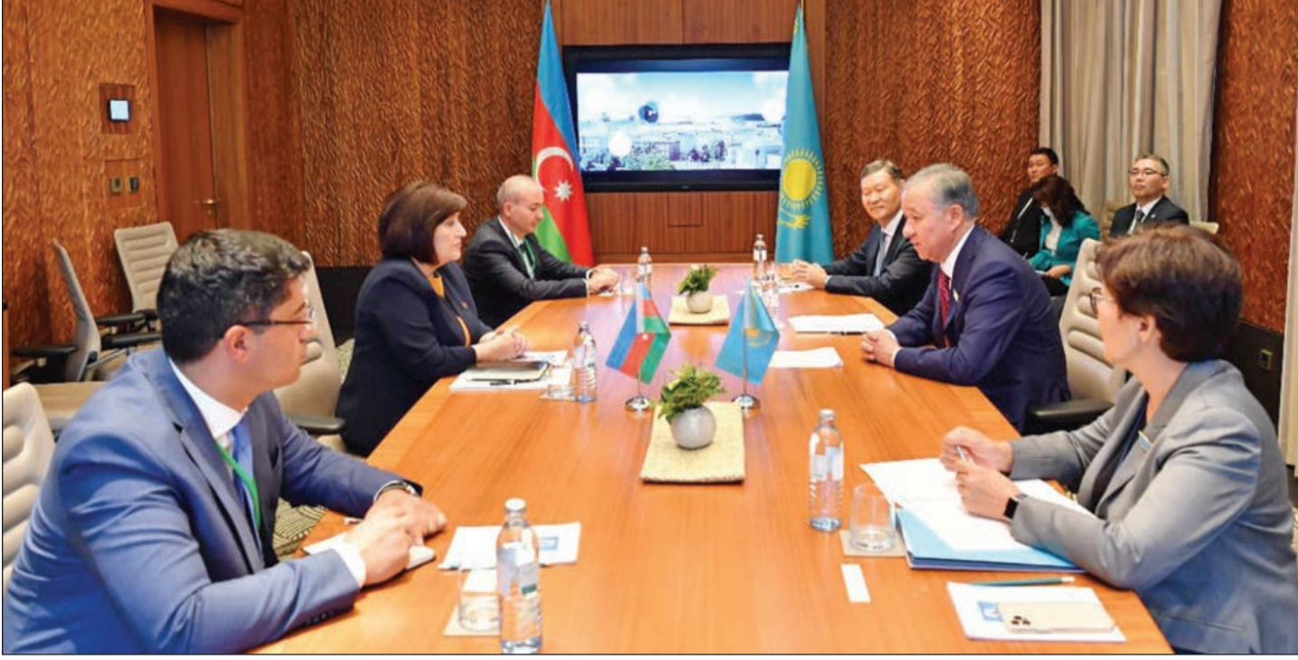
Parlament Sədrlərinin V Ümumdünya Konfransında iştirak etmək üçün Avstriyada işgüzar səfərdə olan Milli Məclisin Sədri Sahibə Qafarova Qazaxistan Parlament Məclisinin Sədri Nurlan Niqmatulinlə görüşüb.

AZƏRTAC xəbər verir ki, Qazaxistan Parlament Məclisinin Sədri Nurlan Niqmatulinin səmimiyyətlə salamlayan Sahibə Qafarova Azərbaycanın dost və qardaş Qazaxistanla münasibətlərin inkişafına böyük əhəmiyyət verdiyini diqqətə çatdırıb. O, Azərbaycan ilə Qazaxistan arasında Ulu Öndər Heydər Əliyev və Qazaxistanın birinci Prezidenti - Elbası Nursultan Nazarbayev tərəfindən əsaslı qoyulan dostluq, qarşılıqlı münasibətlərinin hazırda iki ölkənin dövlət başçıları tərəfindən uğurla davam etdirildiyini bildirib.