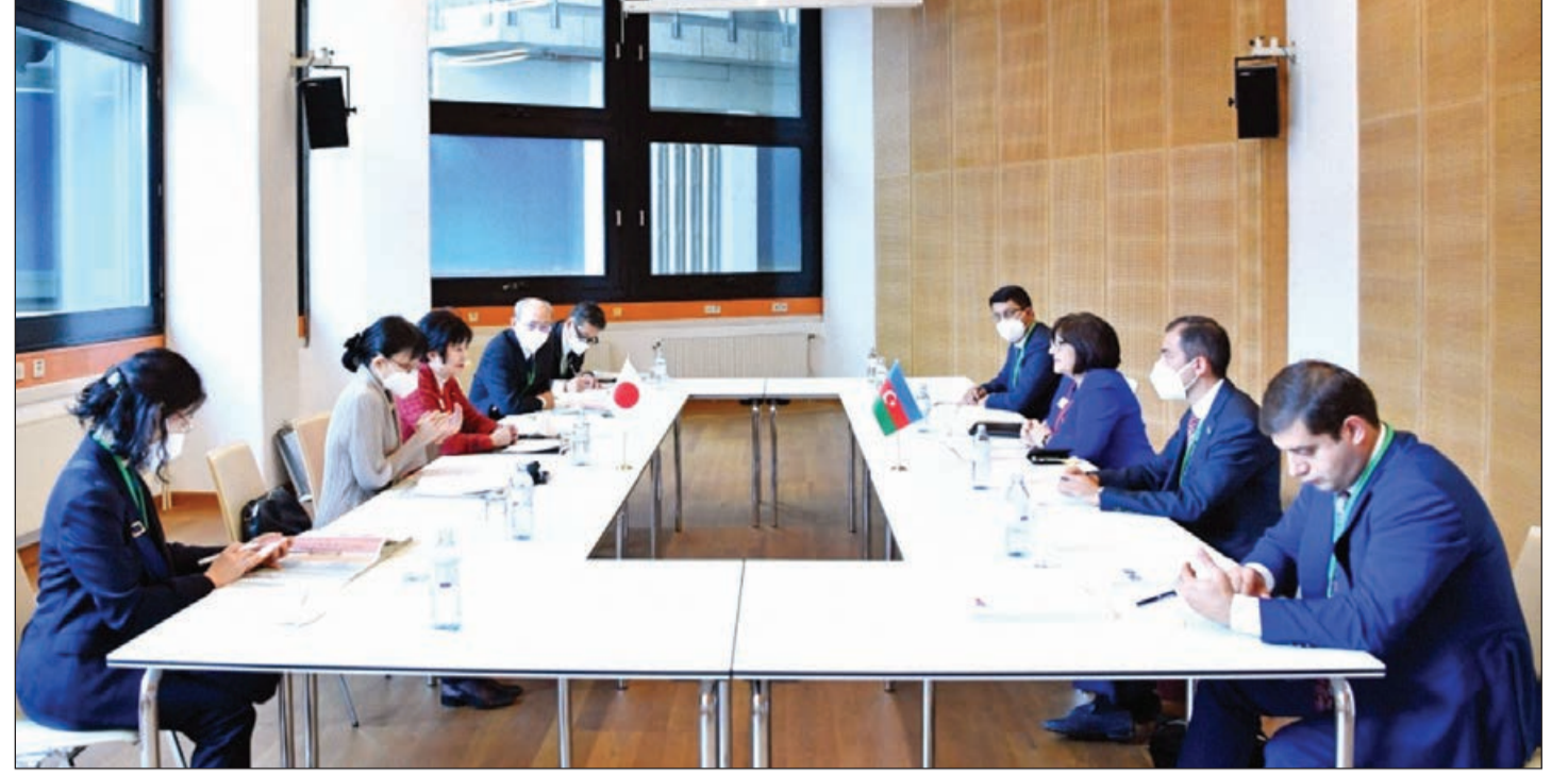
Avstriyanın paytaxtı Vyanada işgüzar səfərdə olan Milli Məclisin Sədri Sahibə Qafarova sentyabrın 7-də Yaponiya Parlamentinin Müşavirlər Palatasının Sədri Akiko Santo ilə görüşüb.

AZƏRTAC xəbər verir ki, yaponiyalı həmkarını salamlayan Milli Məclisin Sədri "Tokio-2020" 32-ci Yay Olimpiya Oyunlarının uğurla başa çatması münasibətilə Akiko Santonu təbrik edib. Milli Məclisin Sədri Azərbaycanın Yaponiya ilə əlaqələrin inkişafında maraqlı olduğunu və bu sahədə yüksək səviyyəli qarşılıqlı səfərlərin həyata keçirilməsində mühüm rol oynadığını diqqətə çatdırıb.