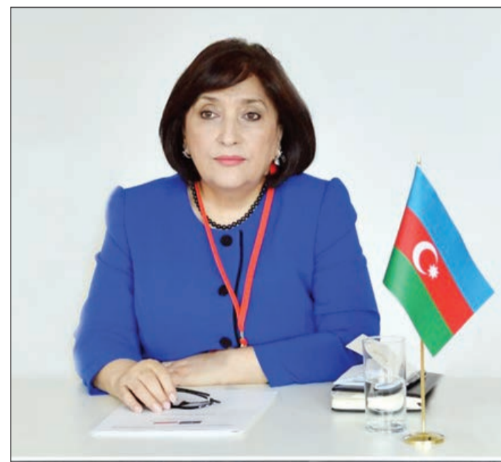
Avstriyanın paytaxtı Vyanada işgüzar səfərdə olan Milli Məclisin Sədri Sahibə Qafarova sentyabrın 7-də Polşa Senatının Sədri Tomas Qrodzki ilə görüşüb.

Milli Məclisin Sədri ölkəmizin bölgədə uzunmüddətli sülhün və sabitliyin təmin edilməsində maraqlı olduğunu, bu istiqamətdə lazımı addımları atıldığını vurğulayıb. O, Azərbaycanın işğaldan azad olmuş ərazilərimizdə bərpa və quruculuq işlərinə başladığını diqqətə çatdırıb. Bununla belə, S.Qafarova Ermənistanın hələ də təcridatçı tədbirlərini davam etdirdiyini və sabitliyə mane olduğunu vurğulayaraq, işğalçı ölkə tərəfindən törədilən təxribatları həmkarının diqqətinə çatdırıb. Polşa Senatının Sədri Tomas Qrodzki parlamentlərarası əməkdaşlığın möhkəmləndirilməsindən, ikitərəfli səfərlərin intensivləşməsinin vacibliyindən danışdı. Ölkə-