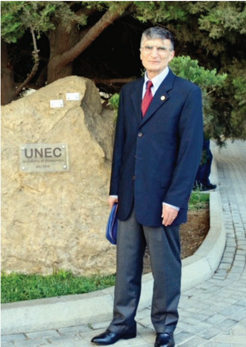
1946-cı ilin 8 sentyabrında Türkiyə Respublikasının Mardin vilayətinin Savur mahalında dünyaya göz açan Aziz Sancar ailesi və yaxınlarından başqa kimsə tanımasa da, indi bütün dünya onun şəxsiyyətini dorin ehtiramla xatırlamaqdadır. Çünki onun həyat yolu bir çox insan üçün həm də əzmkarlıq və uğur hekayəsidir. Bu hekayəyə bələd olanlar isə Aziz Sancarın qazandığı nailiyyətlərinin heç də təsadüfi olmadığını, pərdə arxasında böyük zəhmətin və elmə olan sevginin dayandığına əmindirlər.

Aziz Sancarın həyatı və Nobeledən gələn hekayəsi elə özünün dediyi kimi, gəncləri elmə təşviq etmək, "mümkünsüzü mümkün etmək" amalı daşıyır. Hər çıxışında türk dünyasına olan sevgisini dilə gətirən, vətəneverliyi və milli təsəbbüslərinə qayd edən elm fədasinin yeni-yeni nailiyyətləri imza atacağı, gəncləri elm yolunda yetişdirməkdə davam edəcəyi aşkardır.