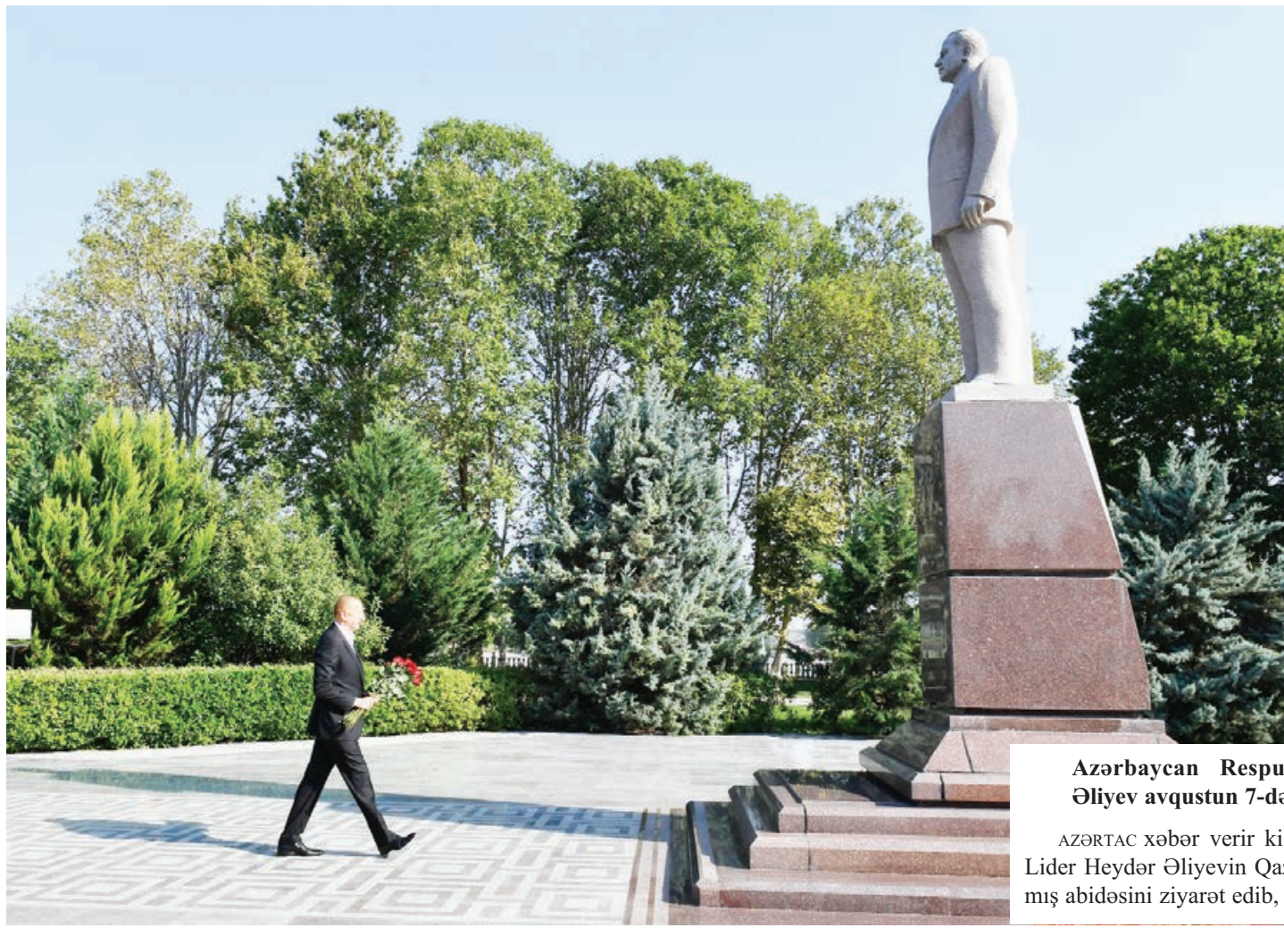
Azərbaycan Respublikasının Prezidenti İlham Əliyev avqustun 7-də Qazax rayonuna səfər edib.

Qazax şəhərində Ümummilli Lider Heydər Əliyevin abidəsini ziyarət