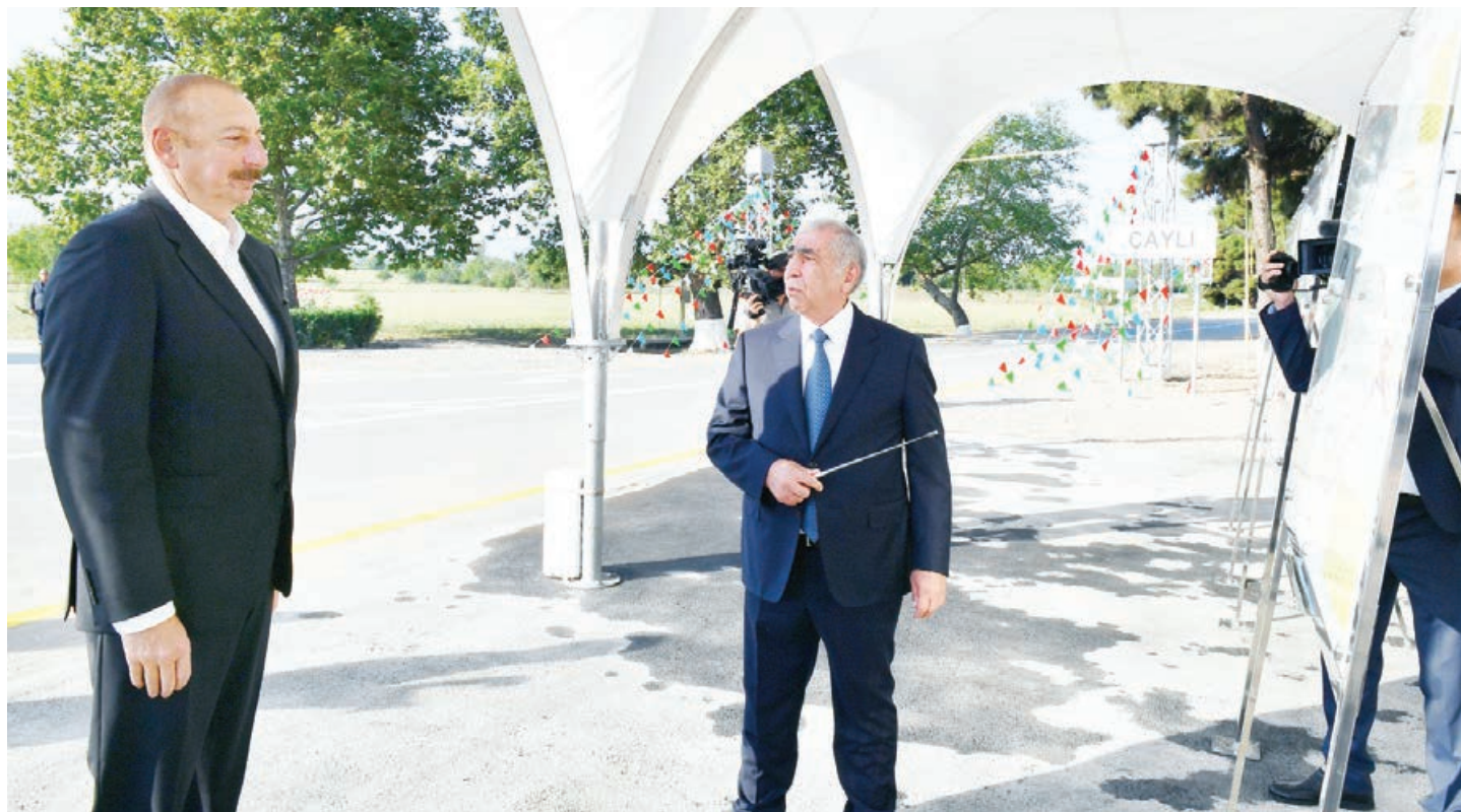
Avqustun 7-də Azərbaycan Respublikasının Prezidenti İlham Əliyev Qazax rayonunda yenidən qurulan Qarapapaq-Çaylı avtomobil yolunun açılışında iştirak edib.