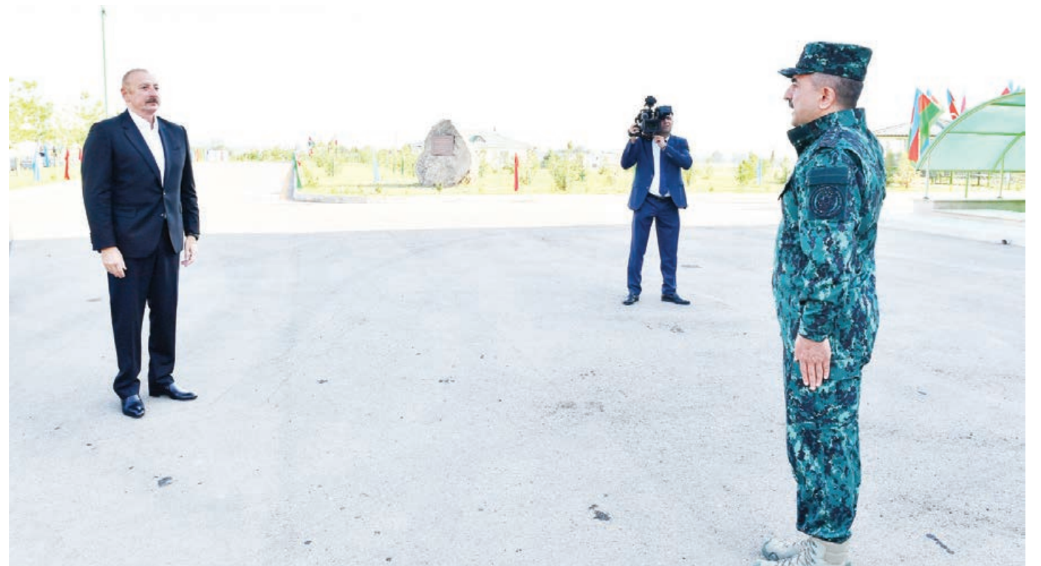
Azərbaycan Respublikasının Prezidenti İlham Əliyev avqustun 7-də Dövlət Sərhəd Xidmətinin (DSX) Sərhəd Qoşunlarının "Qazax" Əlahiddə Sərhəd Diviziyasının qarnizon kompleksində yaradılan şəraitlə tanış olub.