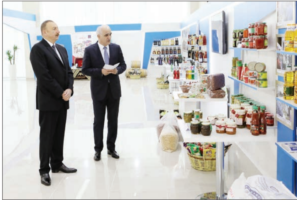
Şahin Mustafayev və İlham Əliyev mağazada

Prezident İlham Əliyev iyulun 31-də sosial-iqtisadi sahə ilə bağlı keçirdiyi müşavirədə biznes mühitinin yaxşılaşdırılması məsələsinə toxunaraq görülən işlərin real nəticələri barədə məlumat vermişdi: “Biznes mühitinin yaxşılaşdırılması istiqamətində aparılan işlər bunu göstərir ki, bu gün iqtisadi sahədə Azərbaycan dünya miqyasında uqurlu inkişaf edən ölkələr sırasındadır. Bununla paralel olaraq, biz sosial sahədə də çox böyük diqqət göstəririk. Bu il reallaşan layihələr - milyardlarla dollar