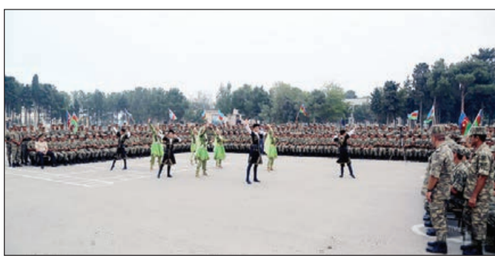
İştirakçılara tədbirin mahiyyəti, şəxsi heyətin asudə vaxtının səmərəli təşkili barədə məlumat verilib. Qeyd olunub ki, belə tədbirlər şəxsi heyətin mənəvi-psixoloji hazırlığına müsbət təsir göstərir və hərbi qulluqçulara böyük ruh yüksəkliyi aşılayır.

Nazirliyin mətbuat xidmətindən AZƏRTAC-a bildirilib ki, əvvəlcə Ulu Öndər Heydər Əliyevin və Azərbaycanın ərazi bütövlüyü, müstəqilliyi uğrunda canından keçən şəhidlərimizin xatirəsi bir dəqiqlik sükutla yad edilib. Dövlət himni səsləndirilib.