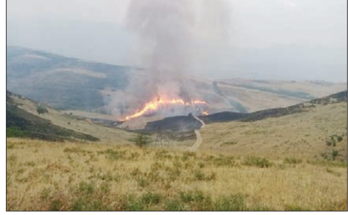
Bildirilib ki, məlumatla əlaqədar FHN-in Dövlət Yanğından Müəhafizə Xidmətinin müvafiq

FHN-in Mətbuat xidmətindən AZƏRTAC-a bildirilib ki, məlumatda nazirliyin 112 - Qaynar telefon xəttinə iyulun 6-da axşam saatlarında Qazax rayonu ərazisində Azərbaycan Respublikasının Ermənistanla sərhəd zolağında yanğının baş verməsi barədə məlumatın daxil olduğu qeyd edilib.