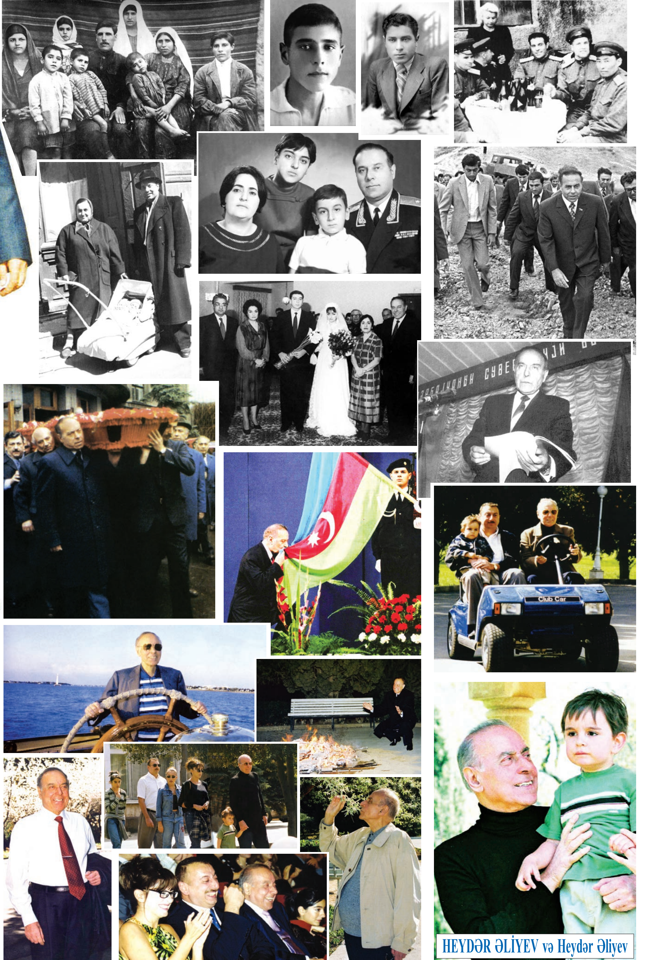
HEYDƏR ƏLİYEV və Heydər Əliyev