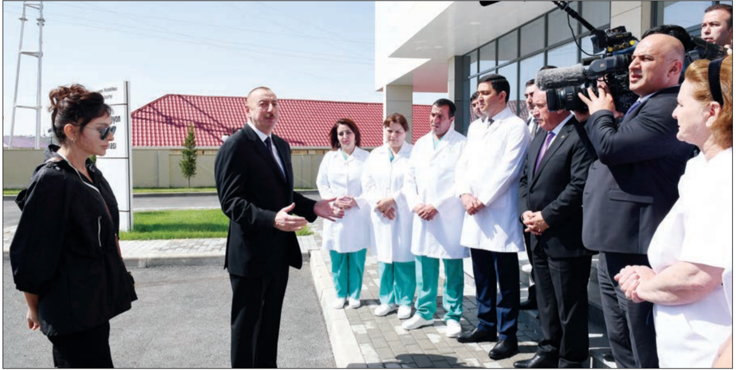
Əvvəli 1-ci səh.

Bütün bu işlər səhiyyə sisteminin təkmilləşdirilməsi, maddi-texniki bazasının möhkəmləndirilməsi istiqamətində atılan addımların mühüm tərkib hissəsidir.