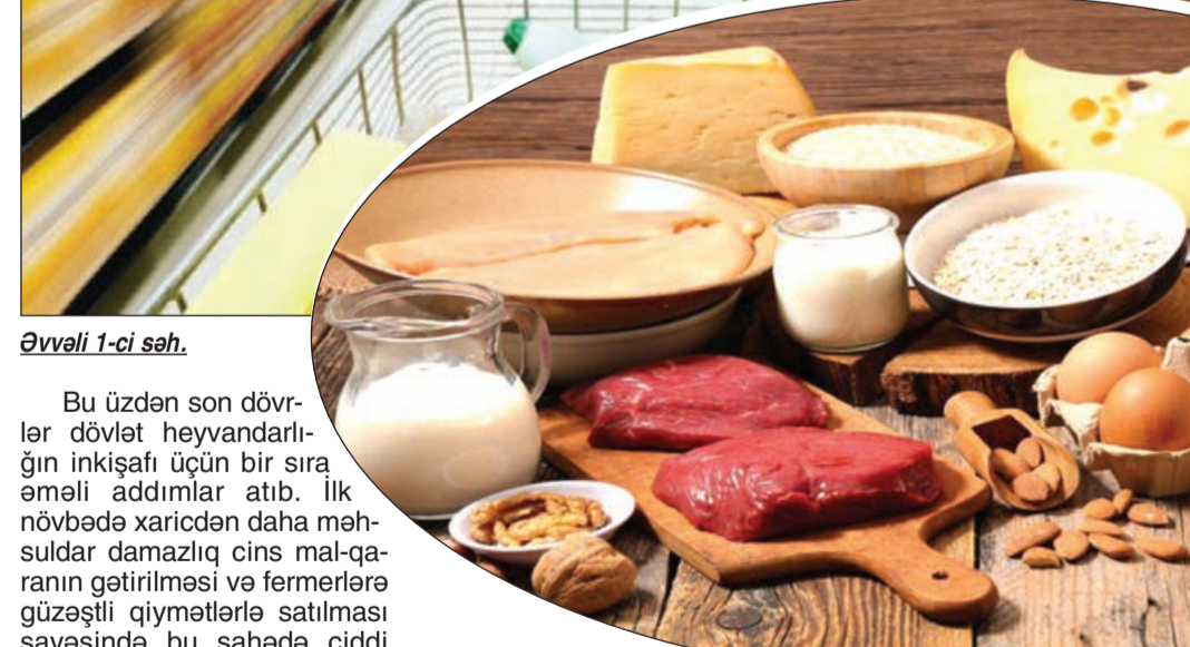
Əvvəlki 1-ci səh.

Bu üzündən son dövrlər dövlət heyvandarlığının inkişafı üçün bir sıra əməli addımlar atıb. İlk növbədə xaricdən daha məhsuldar damazlıq cins mal-qaranın gətirilməsi və fermerlərə güzəştli qiymətlərlə satılması sayəsində bu sahədə ciddi dönüş yaranıb. Eləcə də fermerlərin məhsuldarlığı yüksək olan cins mal-qaradan səmərəli istifadəsi üçün damazlıq təsərrüfatları yaradılıb.