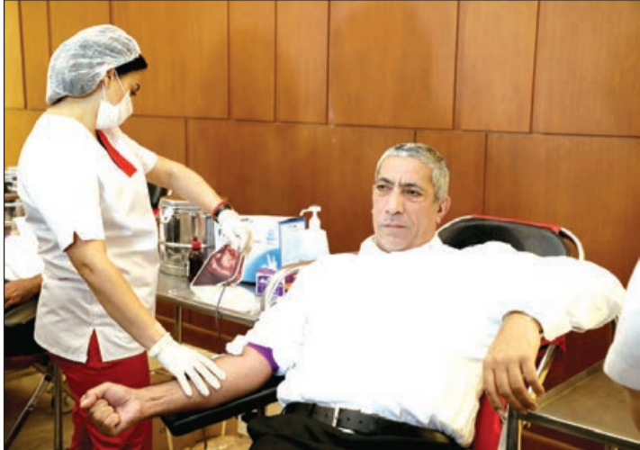
belə aksiyalar gələcəkdə də davam edəcək.