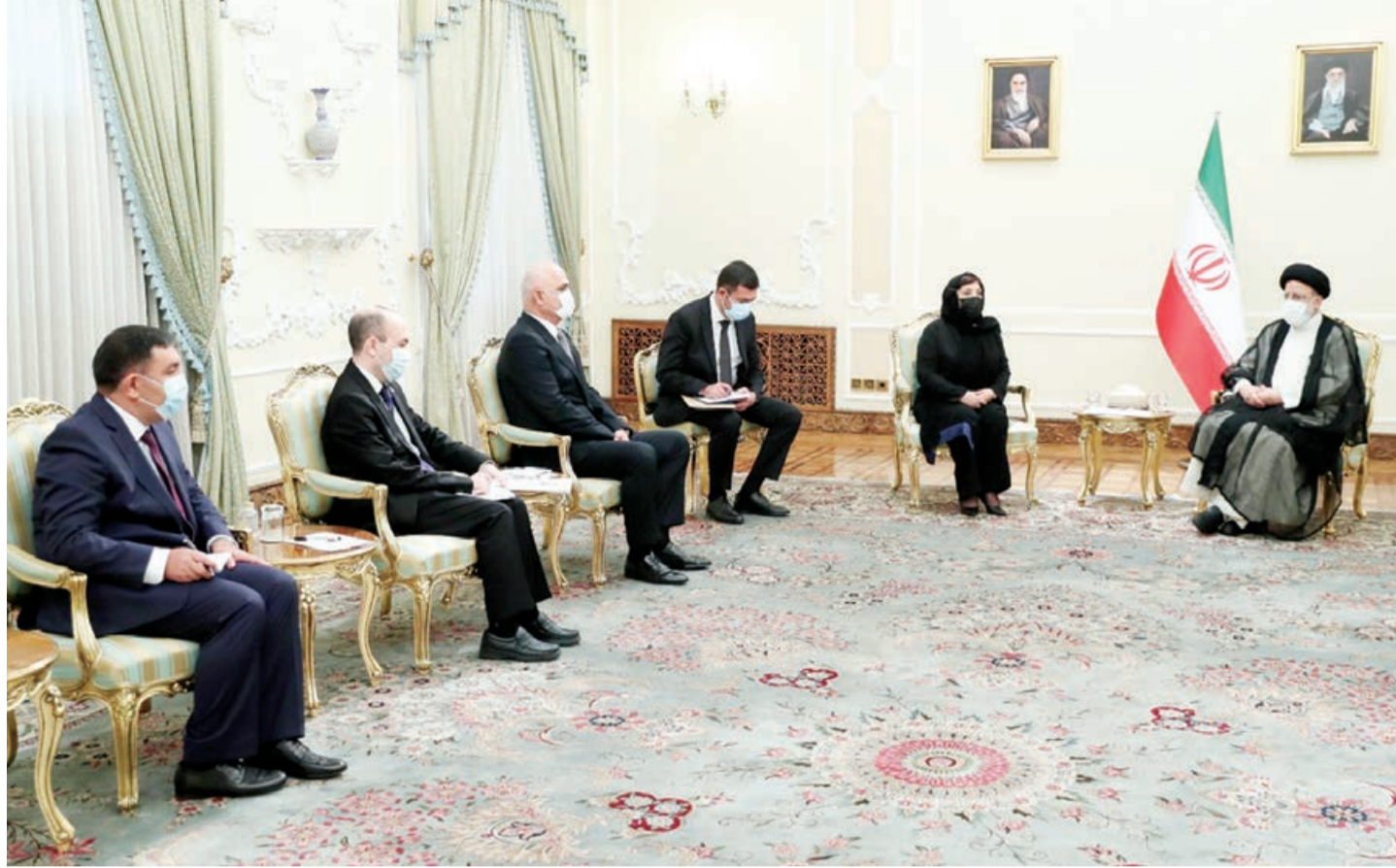
İranda səfərdə olan Azərbaycan Milli Məclisinin Sədri Sahibə Qafarova avqustun 6-da Prezident Seyid İbrahim Reisi ilə görüşüb.

Parlamentin Mətbuat və ictimaiyyətlə əlaqələr şöbəsinin AZƏRTAC-a bildirdikləri ki, Milli Məclisin Sədri Sahibə Qafarova və nümayəndə heyətinin üzvlərini salamlayan Prezident Seyid İbrahim Reisi onun andıçmə mərasimində iştirak etdiyinə görə Azərbaycan nümayəndə heyətinə təşəkkürünü bildirib. O, Vətən müharibəsində əldə etdiyi Qələbə münasibətilə Azərbaycan dövlətini və xalqını təbrik edib. İran Prezidenti Azərbaycan xalqına firavanlıq və xoş günlər arzulayıb.