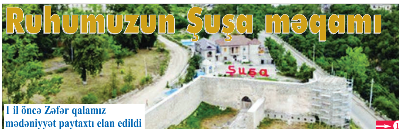
1 il öncə Zəfər qalımız mədəniyyət paytaxtı elan edildi