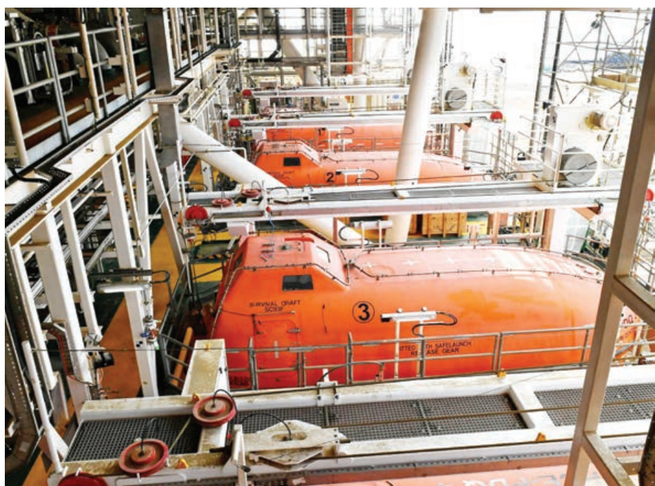
Əsmər QARDAŞXANOVA, "Azərbaycan"

Öncə onu vurğulayaq ki, ACE layihəsi üzrə tikinti işlərinə 2019-cu ildə başlanılıb və işin həcmi 85 faizi artıq tamamlandı. Layihənin pik dövründə tikinti işlərinə 8500 nəfərdən çox işçi cəlb edilmiş, 6 milyard dollarlıq layihəyə yeni dəniz platforması və gündəlik 100 000 barel neft hasilatını təmin edəcək qurğular