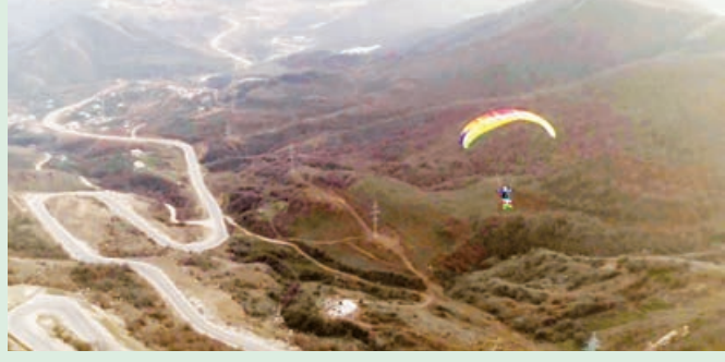
“Şuşa ili” çərçivəsində Şuşa şəhərində son 30 ildə ilk dəfə yamac paraşütündən (paraplan) uçuş həyata keçirilib.