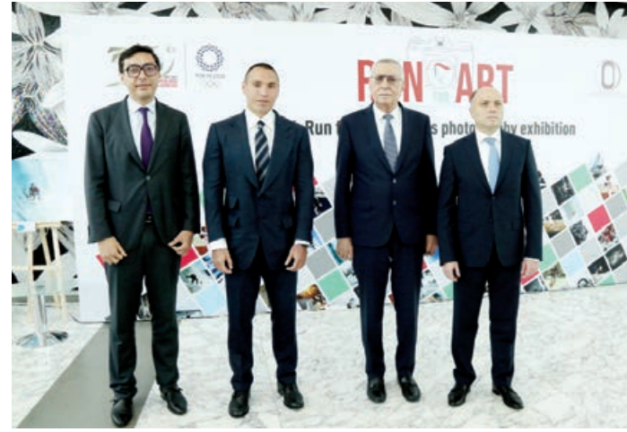
Aprelin 6-da Beynəlxalq Muğam Mərkəzinə "Run for Art" Beynəlxalq Fotomüsabiqəsinin finalçıların sərgisi açılıb.