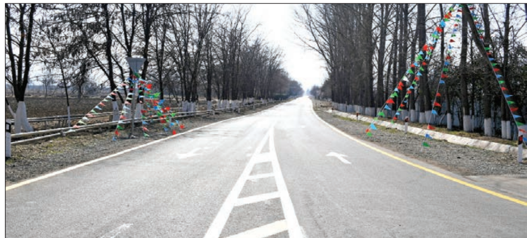
Əvvəli 1-ci şəh.

Ölkəmizdə təkcə avtomobil yollarına diqqət yetirilmir. Eləcə də demir yolunun inkişafı üçün lazım olan tədbirlər görülür. Bununla bağlı keçən il Bakitrafı demir yolu xəttinin çəkilişi xüsusi qeyd edilmişdir. Həmin yol üçün dünyanın aparıcı şirkətlərindən istehsal etdiyi müasir qatarlar gətirilib. Qəsəbələrdə isə yeni demir yolu stansiyaları tikilib. Cari ildə Bakitrafı demir yolunun çəkilişinin əsas mərhələsi başa çatacaq və bununla da dairə birləşəcək. Sonra isə demir yolu olmayan qəsəbələrə yeni demir yolu xətləri çəkiləcək.