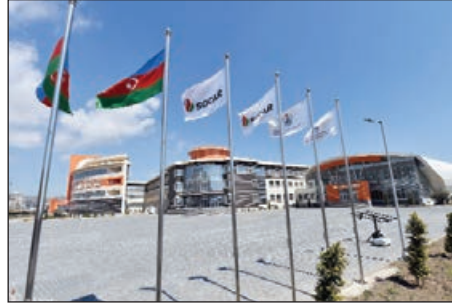
Neft Məktəbinin de bakalavr, magistratura diplom sahibləri müxtəlif təhsil proqramlarına müraciət edə bilər.

BANM-in mətbuat xidmətinin verdiyi məlumata görə, Türkiyənin Ali Təhsil Şurası (YÖK) Bakı Ali Neft Məktəbini (BANM) yüksək standartlara cavab verən ali təhsil müəssisəsi kimi tanıyıb. Belə ki, ali məktəb tərəfindən göndərilən sorğu Ali Təhsil Şurası tərəfindən müsbət rəy alıb. Şura tərəfindən ünvanlanan məktubda qeyd edilib ki, Bakı Ali Neft Məktəbi YÖK-ün mövcud beynəlxalq qurumlar siyahısında yer alır. Həmçinin Türkiyədə qarşılıqlı diplom tanınma qaydalarına uyğun olduğu təqdirdə, xaricdəki bütün ali təhsil müəssisələri kimi, Bakı Ali