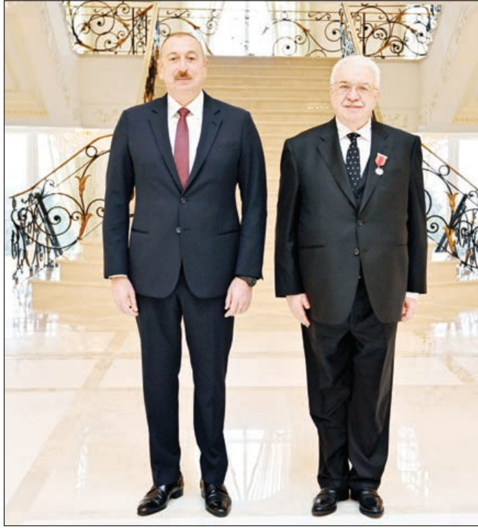
bu sözləri tam səmimiyyətlə söyləyirəm.

Siz bu yaxınlarda burada keçirilmiş tədbirləri xatırladınız. Biz onları “Bakı-Moskva: mədəniyyətlərin dialoqu” adlandırdıq. Əlbəttə, onlar təsadüfən üst-üstə düşmədi. Burada haqiqətən də Rusiyadan görkəmli insanlar oldular. Onların çoxu buraya ilk dəfə gəlmişdi. Onların bizim şəhərə necə heyranlıqla, necə geniş açılmış maraqla dolu gözlərlə, necə səmimiyyətlə baxdıqlarını görmək mənim üçün böyük xoşbəxtlik idi. Lap ələdən mən onlardan bəziləri ilə görüşdüm. Əlbəttə, Siz də bilirsiniz ki, bizim zəngin mətbəximiz, görkəmli memarlığımız, gözəl mədəniyyətimiz var. Onlar isə daha çox onu deyirdilər ki, Azərbaycanda ən əsas insanlardır. İlham Heydər oğlu, Siz böyük xalqın, dünyaya açıq olan xalqın, xeyirxah bir xalqın, qonaqpərvər bir xalqın, igit və öz liderinə inanan bir xalqın Prezidentisiniz. Mənə əla gəlir ki, xalqınızın belə olması Sizin xoşbəxtliyinizdir. Mən