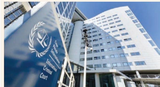
Əvvəli 1-ci səh.

Azərbaycan tərəfinin dəfələrlə müraciətlərinə baxmayaraq, Qarabağda, Şərqi Zəngəzürdə minaladlıqlar bütün ərazilərin xəritəsini verməkdən imtina edir. Bununla Ermənistan azərbaycanlı məcburi köçkünlərin öz evlərinə qayıtmasının qarşısını almağa cəhd göstərir.