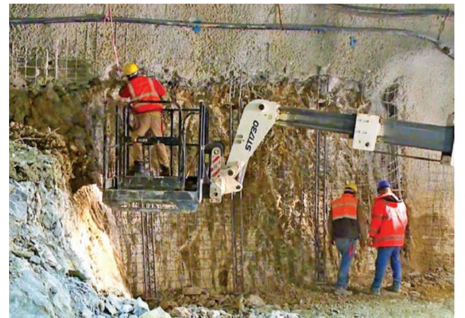
Əvvəlki 1-ci səh.

Dünyanın heç yerində müharibədən sonra qısa vaxtda bu qədər quruculuq işləri görülməyib