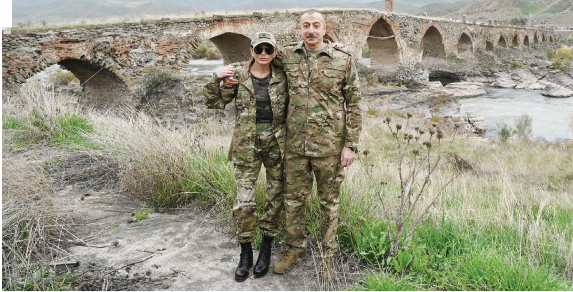
İran müstəqil və güclü Azərbaycanın mövcudluğu ilə bənaş bilmir

Dövlət müstəqilliyini bərpa etdikdən sonra Azərbaycan tarixi keçmiş, mənbəyi dəyərləri, Arazın o tayında on milyonlarla soydaşımızın yaşadığını nəzərə alaraq İranla münasibətlərə xüsusi önəm verib. Məhz bunun nəticəsidir ki, ötən müddətdə ölkələrimiz arasında müxtəlif sahələrdə əhatə edən çoxsaylı ikitərəfli sənədlər imzalanıb.