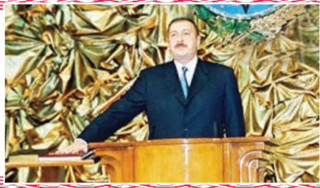
Əvvəli 1-ci səh.

DSX-nin Sahil Mühafizəsinin Gəmi İnşası və Təmiri Mərkəzində müasir tələblərə cavab verən, Xəzər dənizində mürəkkəb üzüm şəraitində xidməti-döyüş tapşırıqlarını icra etməyə qadir olan "Tufan" və "Şahdağ" tipli sərhəd gözetçi gəmilərinin inşası və DSX-nin tərkibində xüsusi hava əməliyyatları qüvvələrinin yaradılması, PUA-ların effektiv döyüş tətbiqi üzrə Azərbaycan sərhədçilərinin peşəkarlığının eksər xarici dövlətin Silahlı Qüvvələrində etalon kimi qəbul edilməsi bütün-lüklə yüksək nailiyyətlərdir.