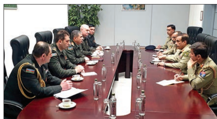
Regiondakı hərbi-siyasi vəziyyətə toxunan Müdafiə naziri Ermənistan-Azərbaycan münasibətlərindən danışdı, bu problemin həllində Pakistanın Azərbaycanın ədalətli mövqeyini beynəlxalq təşkilatlarda da dəstəkləməsinə görə minnətdarlığını bildirdi.

Moskvada işğar səfərdə olan Azərbaycan Respublikasının Müdafiə naziri general-polkovnik Zakir Həsənov sentyabrın 5-də Pakistan İslam Respublikasının Birləşmiş Qərargah Rəisləri Komitəsinin sədri general Nadim Raza ilə görüşüb. Müdafiə Nazirliyindən AZƏRTAC-a bildiriblər ki, görüşdə xalqlarımız arasında ənənəvi dostluq və qarşılıqlı etimadın, eləcə də Azərbaycan-Pakistan əlaqələrinin yüksəlmə xətlə inkişaf etməsindən və strateji tərəfdaşlıq