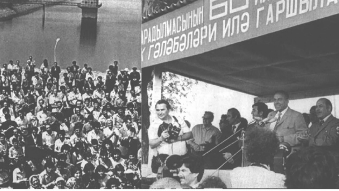
Aşağı Köndölənçay su anbarının açılışı. Füzuli rayonu 1982-ci il.