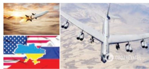
HAWC hipersəmə aviasiya raketinin sınaqları keçirilib.

Amerikalılar vurğulayırlar ki, “Kinjal” sadəcə Rusiyanın kiçik mənzilli “İsgəndər” raketinin versiyasıdır. Başqa sözlə, bu, hipersəmə silahlıdır bir inqilab deyil, dayanıqlı texnologiyanın variantıdır. ABŞ-da isə daha mühərrikə hava-reaktiv mühərrik (GPSD) sınaqdan keçirilib. HAWC raketini də döyüş başlığı