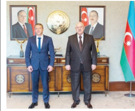
5 aprel tarixdə AZAL prezidenti Cahangir Əsgərovun və İsrailin turizm naziri Yoel Razvozonun görüşü keçirilib.

Tərəflər ölkələr arasında, o cümlədən müli aviasiya və turizm sahəsində