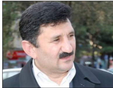
Rey Kərimoğlu Lent.az-a yazır