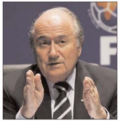
əsnasında müəyyənleşir. Düşünürəm ki, bu mükafatı layiqli futbolçu qazanacaq".

FIFA prezidenti Yozef Blatter yenidən Kristiano Ronaldo və Lionel Messi müqayisəsi haqqında danışdı. Blatter bu iki futbolçu arasında seçim etməyin çətin olduğunu bildirdi: "Həm Ronaldo, həm də Messi fərqli bir fərqlərdir. Bu iki futbolçunu izləmək şansına sahib olduğumuz üçün çox xoşbəxtəm. Təbii ki, bu iki futbolçu arasında seçim etmək çox çətinidir. Ancaq ikisi də dünyanın ən yaxşı futbolçusudur. Onuz da "Qızıl top" mükafatının qalibini biz seçmirik. Bu, Futbol Federasiyaların səsləri