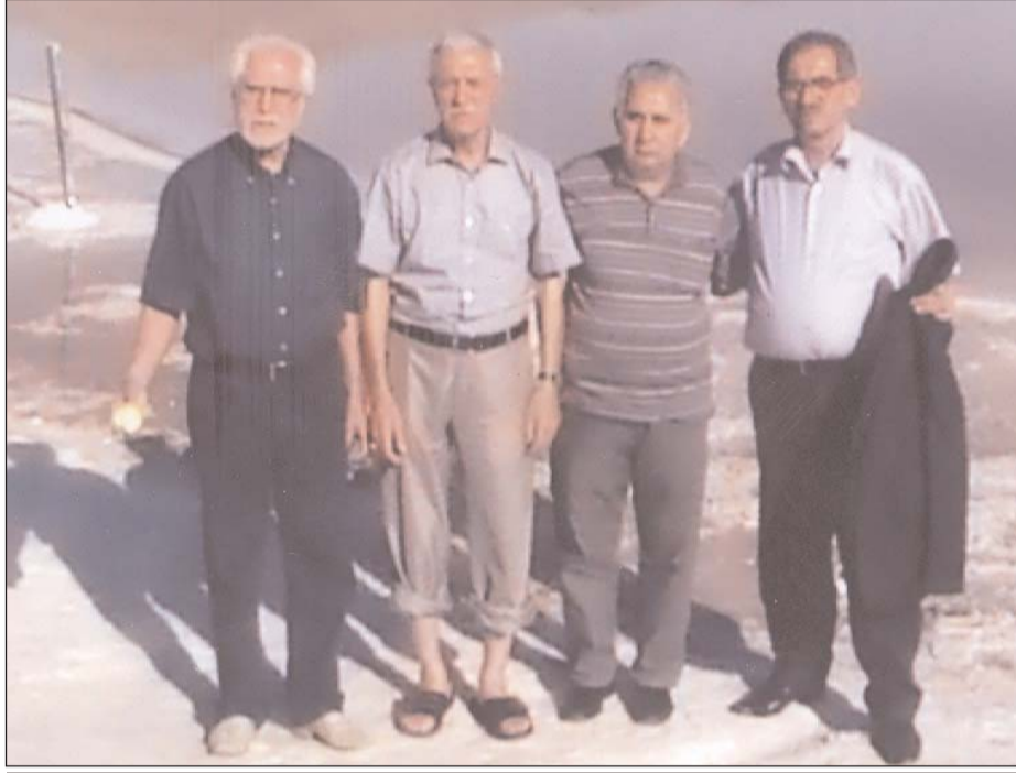
İndi gölün suyuna əl vurmaq üçün 3-4 kilometr düzün üstü ilə getməlisən.

Məşkin tərəflərdə qayalar elə görünürdü ki, guya qüdrətli bir adam onları əli ilə götürüb üst-üstə yığımışdı. Çox təzadlı idi. Bütün sal qayalı dağların östündə yaşıl vadilərə, bağ—bağat görünürdü. Dağ-