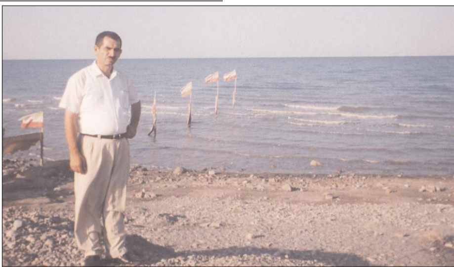
Mən 1999-cu ilin yayında Urmiyada olanda gölün suyu ilə əl-üz yumaq olurdu.

Festival başa çatandan sonra biz ayrı-ayrı qruplara bölünərək Urmiyanın gör-nəli yerlərini ziyarət etdik. Belə yerlər isə istənilən qədərdir. Çəhar bürc, İsmayıl ağə, Bardok, Dam daş tarixi-memarlıq abidələri, memarlıq, tarix və təbiət muzeyləri, Sırr dağı, Qədim bazar və ən nəhayət, Urmiya gölü. Ötən əsrin görkəmli İran alimi Mirzə Ələkbər Dehdaxanın (1879-1956) qədim assur mənbələrinə istinadən "Zərdüştün şəhəri" əldə etdiyi Urmiyanın hər addımı, hər qarışı maraqlı idi. Biz əvvəlcə min illər boyu insanların sirlə məkən kimi baxdıqları Sırr dağına baş çəkdi. Urmiya şəhəri bu dağın demək olar ki, dörd tərəfdən qurşaq kimi əhatələnir. Hündür binalar bir-birinin əlindən tutaraq nəhəng ağacı dövrələyən uşaqlar kimi görünür. Doğrusu orada biz hansısa