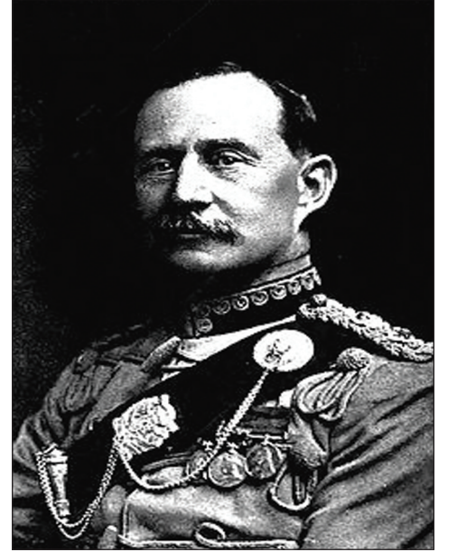
General Lionel Çarlz Densterville

Əsas tezislərini gündəliyinə köçürdüyü çıxışında o, demişdi: “Artıq Bakının taleyi ilə bağlı ciddi qərar qəbul etmək vaxtıdır. Güman və ümidlər bir tərəfə buraxılmalıdır. Ancaq faktlarla hesablmalıyıq. Faktlar belədir: vuruşan yalnız mənim əsgərlərimdir. Onların sayı isə cəmi 900 nəfərdir. Bundan sonra heç bir əlavə qüvvə olmayacaq. Türklər bütün hücumlardan qalib çıxırlar. Deməli, həlledici savaş üçün özlərində kifayət qədər cəsarət tapan kimi şəhərə girəcəklər. Dünyə generalların planının adı matros tərəfindən rədd edildiyi hərbi şuranın iştirakçısı oldum. Hələ onu demirəm ki, belə planların ümumiyyətlə heç bir mənası yoxdur! Bu gün səhər isə Binəqədi təpəsinin türklər tərəfindən ələ keçirildiyi döyüşü müşahidə etdim. Düşməni oradan vurub çıxarmaq üçün kiçik bir həmlə kifayət idi. Amma əvəzində sizin əsgərlərin arxalarını düşməne çevirib əllərini ciblərinə qoyaraq Bakıya tərəf yol aldıklarını müşahidə etməli oldum. Bundan sonra yenidən baş komandanla görüşdüm. Bir daha planları müzakirə etdik. Mənə elə gəlir ki, artıq hər şey aydındır. Yaxşısı budur özünüz fikirləşin: əgər hücum əmri verildə əsgərləriniz həmişə qaçmağa fürsət axtarırsa, xəritələri öyrənməyin, yaxud yeni, möhkəmləndirilmiş istehkamlarla bağlı müzakirələr aparmağın nə mənası var? Əgər ordunuz döyüş meydanından qaçmaqdan başqa bir şey bacarmırsa, bu can çə-