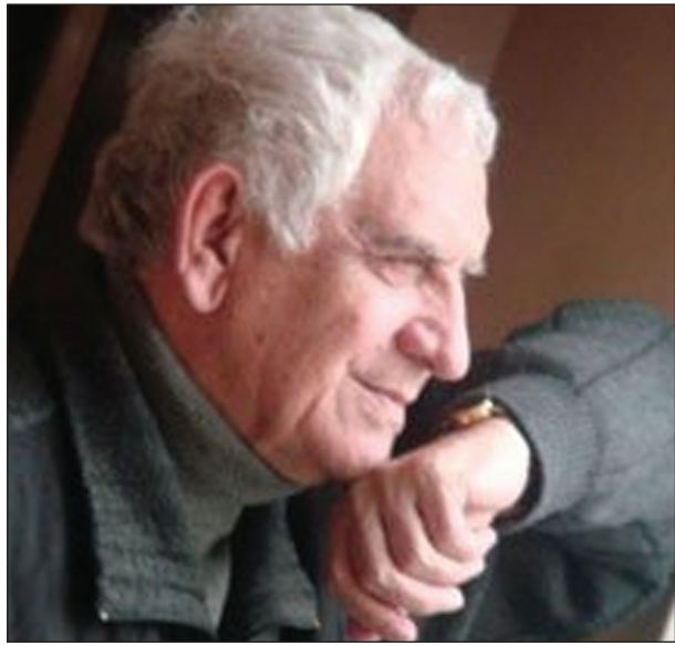
Nəriman HƏSƏNZADƏ, Xalq şairi