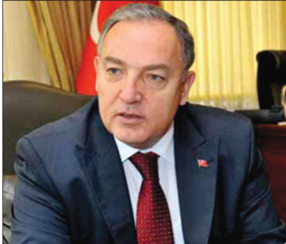
səfir oktyabrın 1-dən yeni vəzifədə fəaliyyətə başlayacağını bildirib.