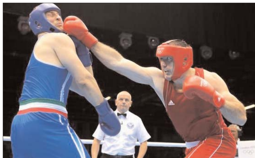
Arđt 3-cü sah.

Bu yerə diqqətinizi daha bir fakta cəlb etmək istərdik. Məlumdur ki, Azərbaycan tarixində ilk dəfə London olimpiadasında daha çox idmançıyla — 53 nəfərlə qatılmışdı. 53 idmançımdan isə, yuxarıda qeyd etdiyimiz kimi, 10 nəfəri medal qazanıb ki, bu da ümumi nəticədə 18,9 faiz deməkdir. Əgər idmançılarımızı sayı daha çox olsaydı, təbii ki, medalların sayı bundan artıq da ola bilərdi. Qeyd edək ki, faiz göstəricisinə görə, Azərbaycan "London-2012"ni ilk beşlikdə başa vuran və bizzənd xeyli sayda artıq atletlə yarışlara qatılan üç ölkəni — Britaniya, Rusiya və Koreyanı geridə qoyub.