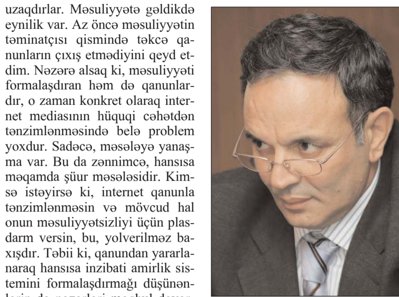
Proses Azərbaycan üçün də xarakterikdir.

Digər tərəfdən, siz “azad sosial şəbəkə” ifadəsini işlətdiniz. Azad olan prinsipçə təkcə internet mediası deyil, digərləri də həmin statusdadırlar. Burada söhbət sərbəstlikdən, ən əsası isə məsuliyyətdən gedir. Sərbəstliyə gəlincə, bəli, hazırda xəbər resursları, deyək ki, ənənəvi KİV-lər kimi müxtəlif vergi ödənişlərindənmi və sair bu kimi tələblərdənmi