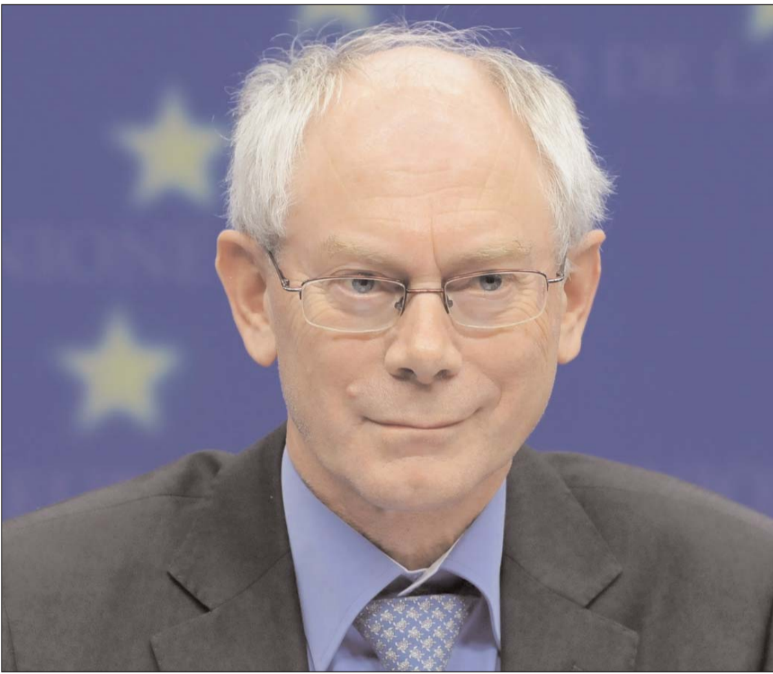
Azərbaycan prezidenti ötən dövrdə ölkəmizdə

İ.Əliyev qeyd edib ki, Avropa Birliyi ilə münasibətlər iqtisadi əməkdaşlığı, enerji təhlükəsizliyi və digər sahələrdə əhatə edir. Dövlət başçısı AB-yə üzv olan ölkələrlə əlaqələrin yüksək səviyyədə olduğunu vurğulayıb: “Avropa Birliyinə üzv ölkələr ilə əlaqələrimiz çox güclüdür, bu əlaqələr həmçinin qarşılıqlı maraqlara söykənir. Bütün bunların Bakıda aparılan danışıqların mövzusunun təşkil edib”.