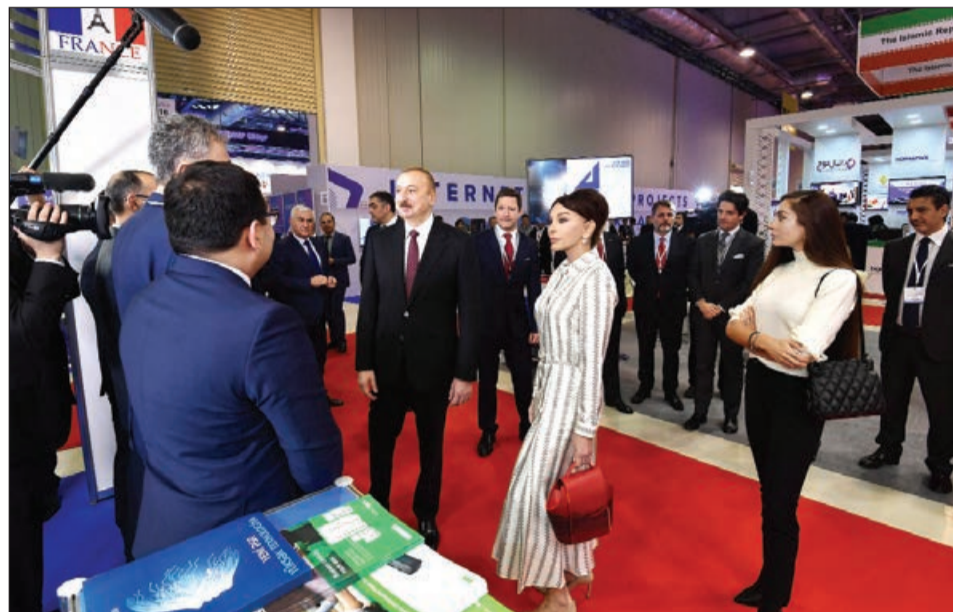
Əvvəlki 1-ci sah.

Bildirildi ki, yubiley sərgisində 23 ölkədən 238 şirkət iştirak edir. Türkiyə, Rusiya, ABŞ, Belarus, BƏƏ, Fransa, İran, İsrail, İtaliya, Sloveniya, Xorvatiya və digər ölkələrin ticarət palataları və səfirliklərinin dəstəyi ilə aparıcı IT şirkətlərindən ibarət milli qruplar sərgidə təmsil olunur. Sərgiyə 11 ölkə milli pavilyonla qatılıb. Sərginin debütantlarının sayı ümumi iştirakçıların 30 faizini təşkil edir. Stendlərdə həm iş, həm də gündəlik həyat üçün “ağıllı” həllər təklif olunur. Hər il olduğu kimi, bu il də tədbirdə bir-birindən maraqlı layihələr təqdim edən stendlər qurulub. Sərgi Xəzər bölgəsində innovasiya və yüksək texnologiyalar sahəsində ən böyük hadisə olmaqla yanaşı, işgüzar əlaqələrin qurulması üçün də nadir məkandır.