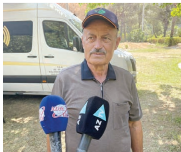
Xatırladaq ki, Fövqəladə Hallar Nazirliyinin (FHN) yanğınsöndürmə əməkdaşlarından, hava nəqliyyatı və texnikadan ibarət qüvvələr Türkiyədəki meşə yanğınlarına qarşı fəal müdaxilədə iştirak edirlər.