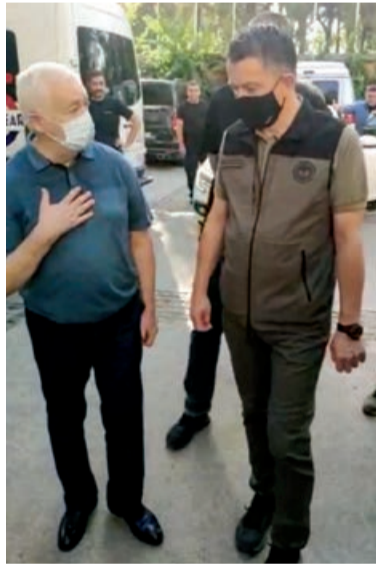
publikasının Prezidenti İlham Əliyevin tapşırığı ilə FHN-in

FHN-in Mətbuat xidmətindən AZƏRTAC-a bildiriblər ki, görüşdə E.Mirzəyev Türkiyədə baş verən meşə yanğınları ilə mübarizə aparmaq üçün Azərbaycan Res-