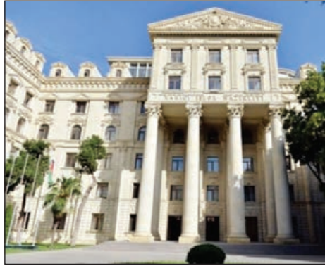
AZƏRTAC xəbər verir ki, bu barədə Xarici İşlər Nazirliyinin Mətbuat xidməti idarəsi məlumat yayıb.

Azərbaycan Respublikasının Baş Prokurorluğu və Daxili İşlər Nazirliyinin birgə məlumatına əsasən, 2021-ci il iyunun 4-də səhər saatlarında Kəlbəcər rayonunun Susuzluq kəndi ərazisində hərəkət olan yolda çəkiliş qrupunun üzvlərini aparan nəqliyyat vasitəsi tank əleyhinə minaya düşüb.