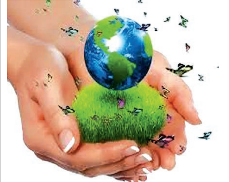
Əvvəli 1-ci səh.

Təəssüf ki, hələ də ona övlad ola bilmirik