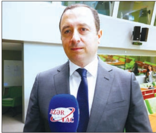
təqdim edərək, onun Azərbaycanın Ermənistanla qarşı 2021-ci il 15 yanvar tarixli birinci

Qeyd olunmalıdır ki, Azərbaycan hazırkı dövlətlərarası şikayəti Avropa Məhkəməsinə