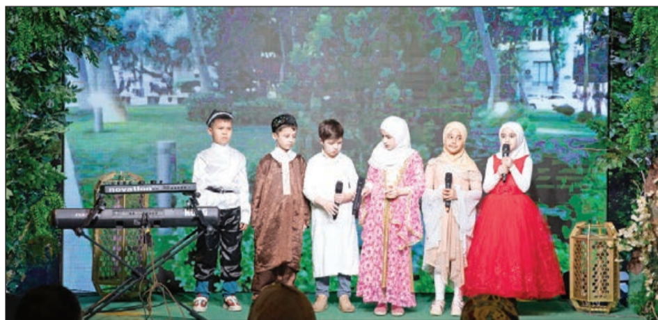
Qeyd edək ki, Rusiya Müftülər Şurasının mühüm layihəsi olan "Ramazan çadırı" xalqlar arasında dostluğu möhkəmlətmək, Moskvada yaşayan və islam dininə etiqad bəsləyən çoxsaylı xalqların nümayəndələrini birləşdirmək məqsədilə həyata keçirilib. Heydər Əliyev Fondunun Rusiya Federasiyasında nümayəndəliyi hər il bu layihədə fəal iştirak edir, din-darlar üçün iftar süfrəsi açır.