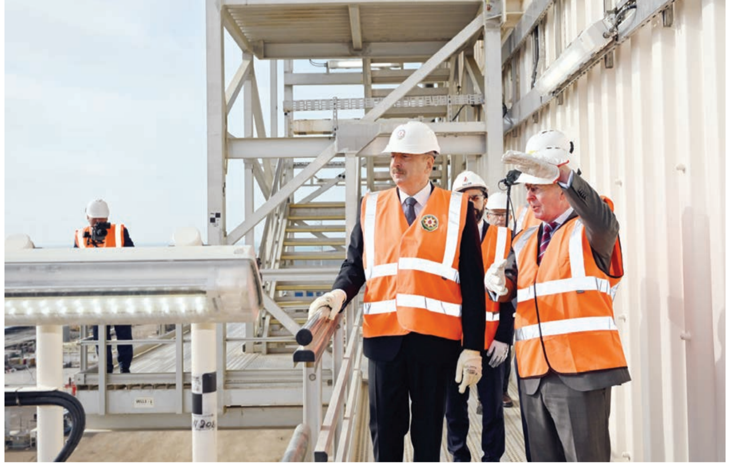
Əvvəli 1-ci sah.

Bu xətlər platformadan hasil ediləcək neft və qazın Səngəçal terminalına ötürülməsi üçün mövcud AÇG "Faza 2" sualtı ixrac kəmərlərinə qoşulacaq.