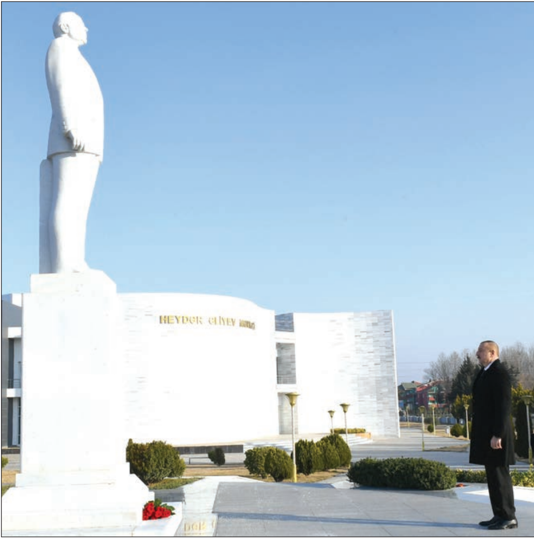
Azərbaycan Respublikasının Prezidenti İlham Əliyev martın 4-də Ağstafa rayonuna səfərə gəlib.

Ağstafa filialı regionda xalçaçılığın inkişafına böyük töhfə verəcək