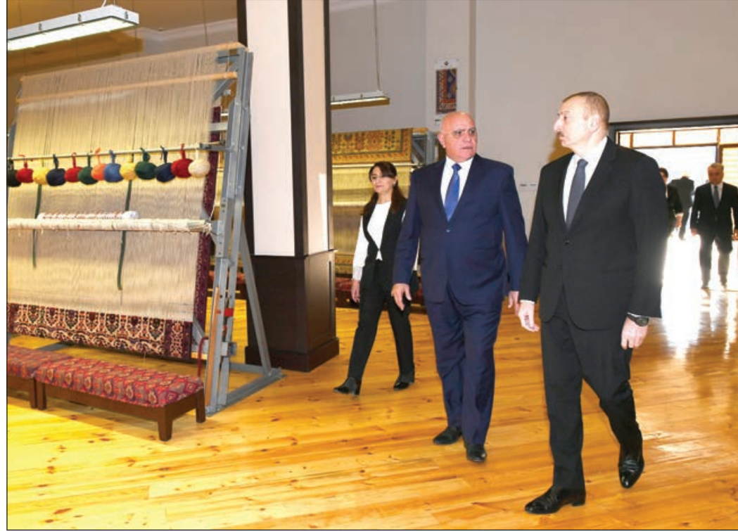
Azərbaycan Respublikasının Prezidenti İlham Əliyev martın 4-də "Azərxaç" Açıq Səhmdar Cəmiyyətinin Ağstafa filialının fəaliyyəti ilə tanış olub.

Amma Azərbaycan Prezidenti bu addımı ilə bir daha göstərdi ki, ölkənin regionlarında vəziyyət, insanların problemlərinin həlli dövlət başçısı üçün prioritet məsələdir.