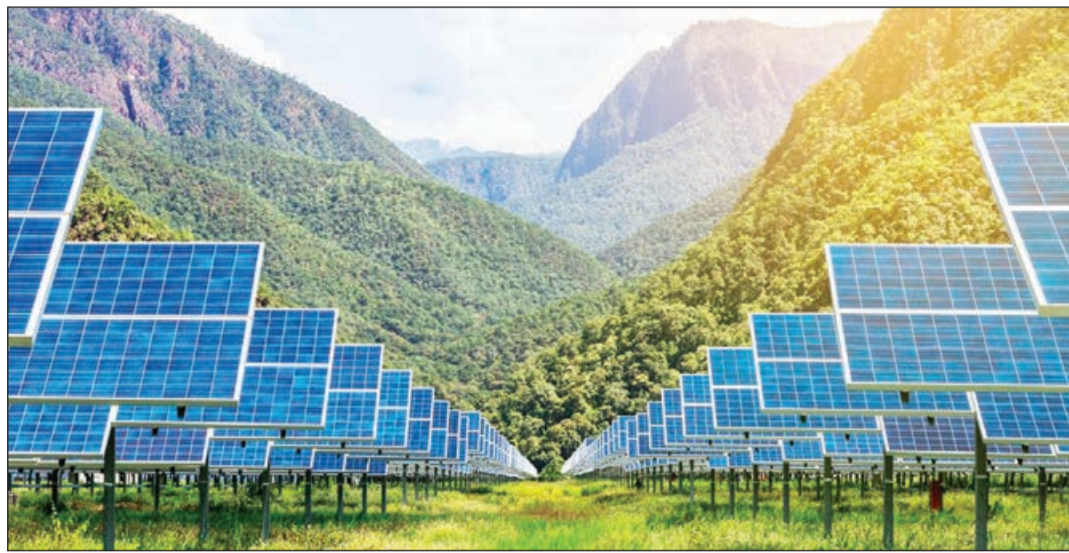
Əvvəli 1-ci səh.

Bu hesaba 10 ildən sonra Azərbaycanda elektrik enerjisinin 30 faizini bərpaolunan enerji təşkil edəcək