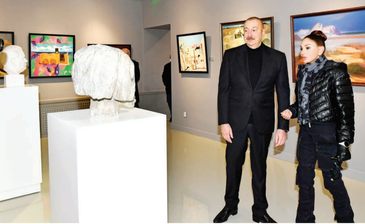
Əvvəli 1-ci sah.

İlham Əliyevin Şəki və Oğuzda açılışlarında və təməlinin qoyulmasında iştirak etdiyi müəssisələr bölgələrdəki yüksəlişin nümunələridir