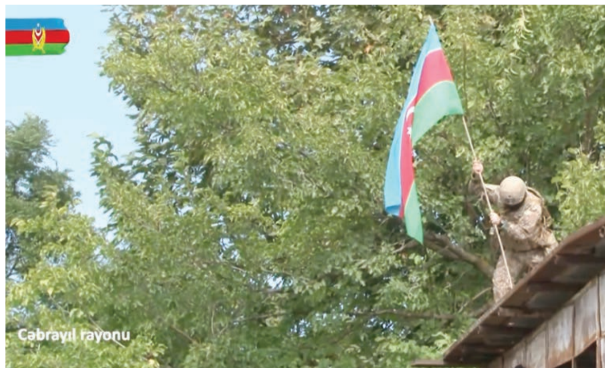
Azərbaycan öz məqsədlərinə doğru irəliləyir

Cəbrayıl əməliyyatının əhəmiyyətindən söz açan dövlət başçısı dedi ki, Cəbrayıl azad olunan sonra işğal altında olan digər rayonlara uğurlu addımlarımız mümkün olub. Cəbrayıldan sonra Zəngilan, ondan sonra Qubadlı və Laçın rayonunun