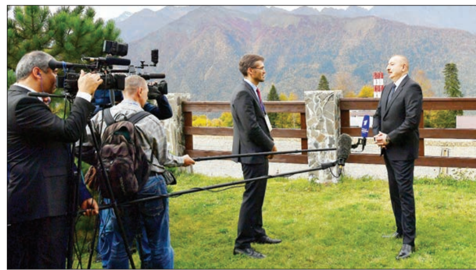
AZƏRTAC-ın xüsusi müxbiri xəbər verir ki, Azərbaycan Respublikasının Prezidenti İlham Əliyev oktyabrın 3-də Soçidə Rusiyanın “Rossiya” və “Birinci” televiziya kanallarının müxbirlərinin suallarını cavablandırır.

Soçidə “Valday” Beynəlxalq Diskussiya Klubunun XVI illik iclasının plenar sessiyası keçirilib Prezident İlham Əliyev sessiyada iştirak edib