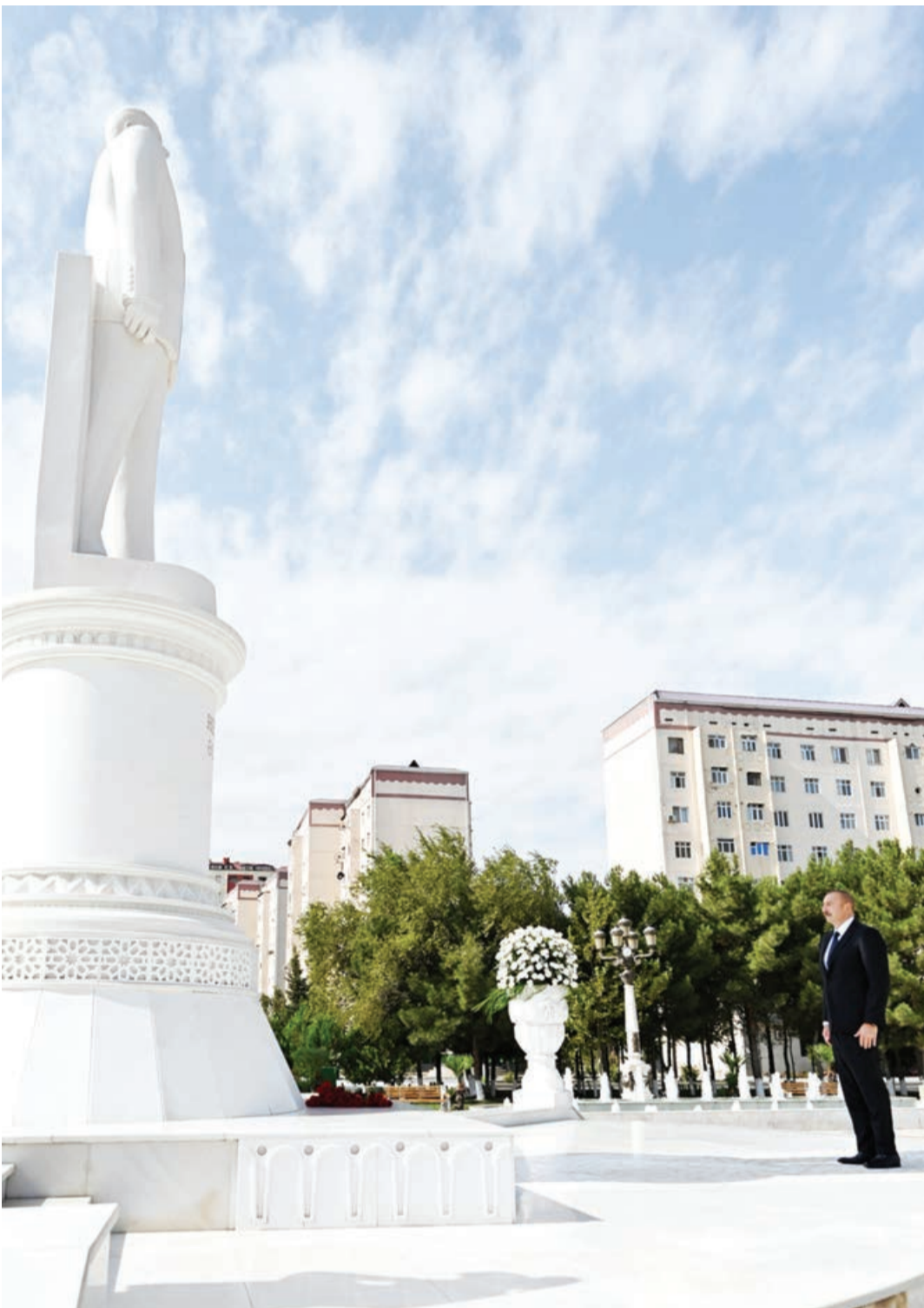
Azərbaycan Respublikasının Prezidenti İlham Əliyev sentyabrın 3-də Sumqayıt şəhərində səfərdə olub.

AZƏRTAC xəbər verir ki, dövlət başçısı əvvəlcə Ulu Öndər Heydər Əliyevin şəhərin mərkəzində ucaldılan abidəsini ziyarət edib, önünə gül dəstəsi qoyub.