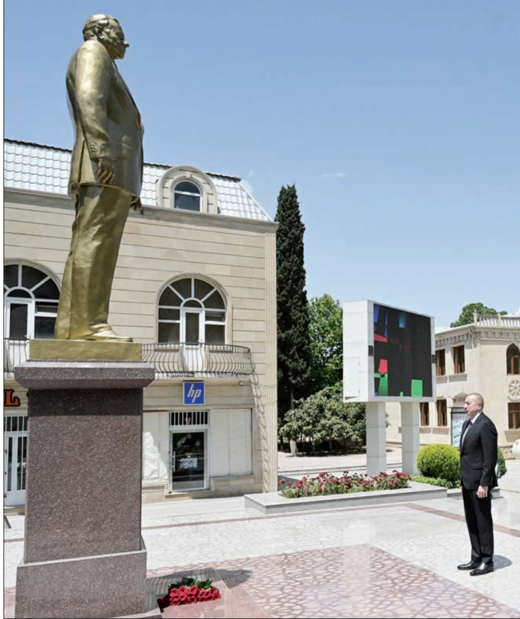
Azərbaycan Respublikasının Prezidenti İlham Əliyev iyunun 3-də Tartar rayonunda səfərdə olub. AZƏRTAC xəbər verir ki, dövlət başçısı Ümummilli Lider Heydər Əliyevin Tartar şəhərinin mərkəzində ucaldılmış abidəsini ziyarət edərək önünə gül dəstəsi qoydu.

Ulu Öndər Heydər Əliyevin abidəsini ziyarət