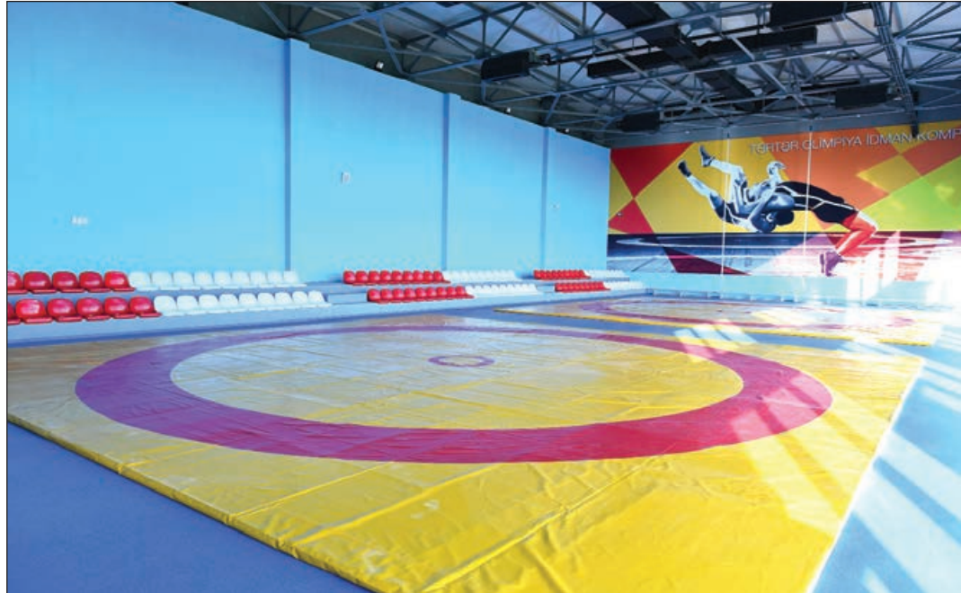
Əvvəli 3-cü səh.