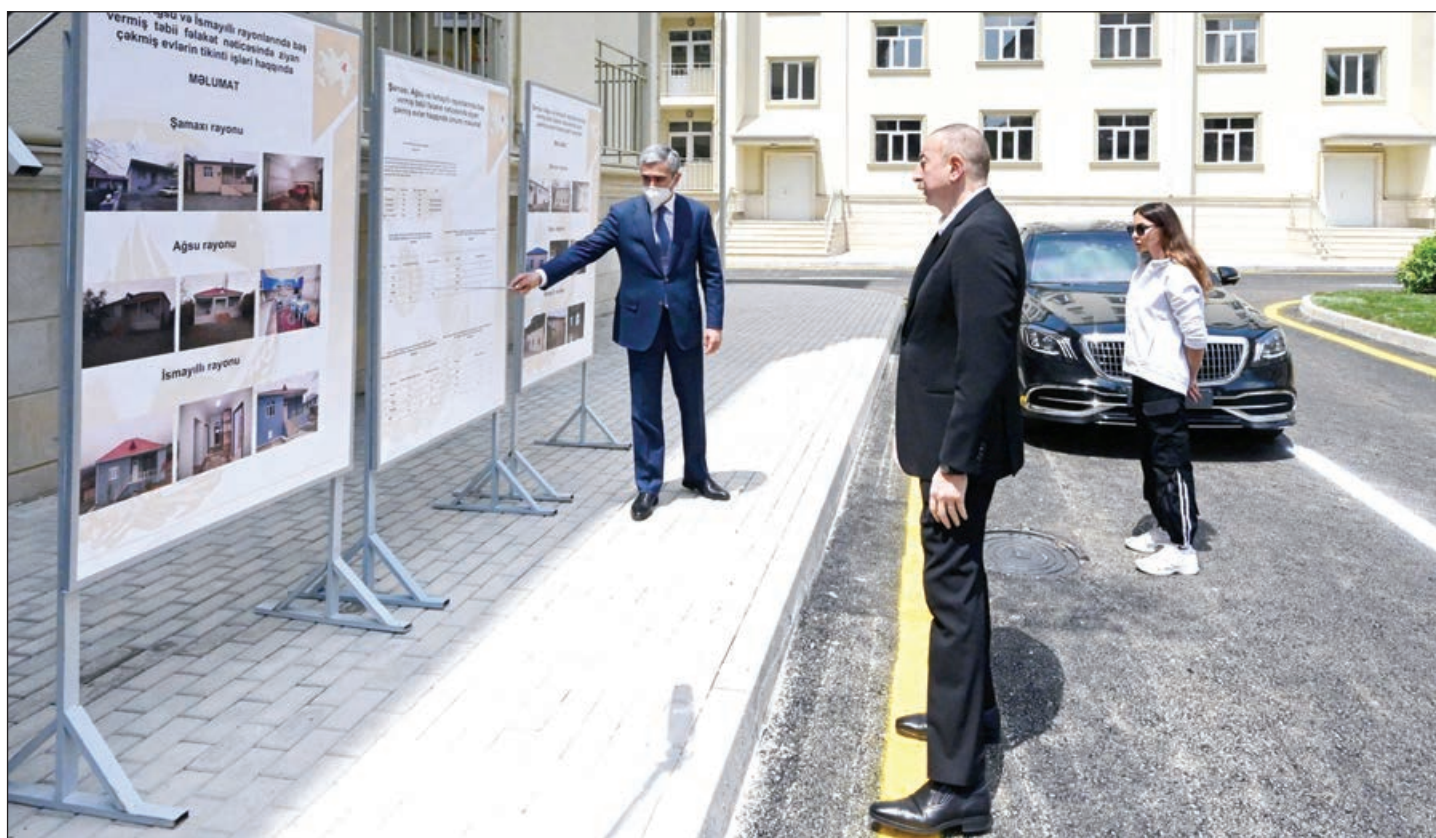
Əvvəli 1-ci sah.

Prezidentin Şamaxıda zəlzələdən əziyyət çəkən sakinlər üçün tikdirdiyi çoxmənzilli binalara böyük köç başlayıb