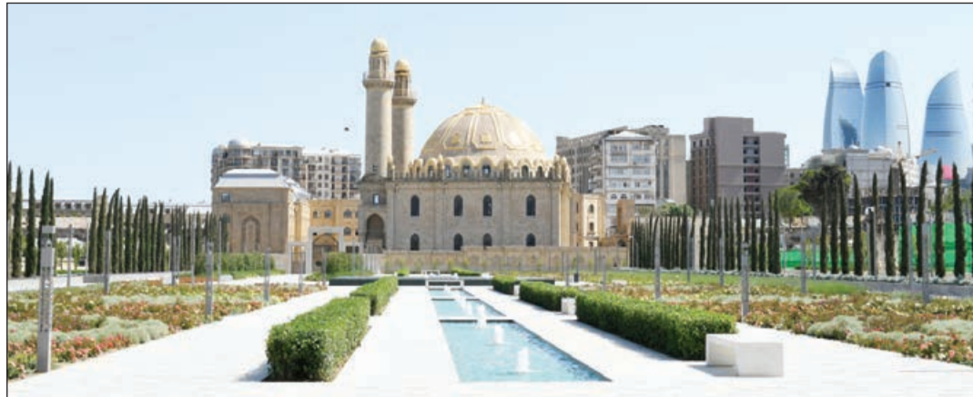
Əvvəlki 1-ci səh.

Vaxtilə fitrə buğda, arpa, xurma, düyü, kişmiş və s. ərzaq məhsullarından adambaşına təxminən 3 kiloqram həcmində ödənilirdi. Zaman keçdikcə kasıblara və ehtiyacı olanlara münasibətdə göstərilən bu xeyirxahlıq başqa formalar da almışdır. İndi fitrəni pul şəklində də verirlər. Əslində, bu, daha münasibdir. Belə ki, fitrəni pul kimi qəbul edən şəxs onu öz ehtiyacına uyğun şəkildə xərcləmək imkanı əldə edir. Özü də fitrə yalnız halal maldan verilməlidir.