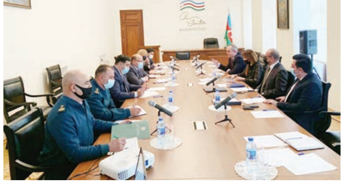
Azərbaycan Respublikasının işğaldan azad edilmiş ərazilərdə məsələlərin mərkəzləşdirilməsi qaydada həlli məqsədilə yaradılmış Əlaqələndirmə Qərargahının nəzdində fəaliyyət göstərən İdarələrarası Mərkəzin Minalardan və partlamamış hərbi sursatlardan (PHS) təmizləmə üzrə İşçi Qrupunun növbəti iclası keçirilib.

AZƏRTAC xəbər verir ki, iclasda Azərbaycan Respublikasının Nazirlər Kabineti, Azərbaycan Respublikası Prezidentinin Administrasiyası, Azərbaycan Respublikasının Xarici İşlər Nazirliyi, Azərbaycan Respublikasının Minaların Təmizləmə Agentliyi (ANAMA), İqtisadiyyat Nazirliyi, Fövqəladə Hallar Nazirliyi və Dövlət Sərhəd Xidməti nümayəndələri iştirak ediblər.