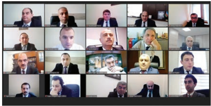
Azərbaycan Respublikasının işğaldan azad edilmiş ərazilərdə məsələlərin mərkəzləşdirilməsi qaydada həll edilməsi üçün yaradılmış Əlaqələndirmə Qərargahının nəzdində fəaliyyət göstərən İdarələrarası Mərkəzin Enerji təminatı məsələləri İşçi Qrupunun videokonfrans formatında növbəti iclası keçirilib.

AZƏRTAC xəbər verir ki, iclasda Şuşa şəhərinin əsas bina və obyektlərinin istilik enerjisi ilə təmin olunması üzrə görülən işlərlə bağlı aparılmış növbəti monitorinqin nəticələri haqqında məlumat verilib, enerji təminatında keyfiyyətin və davamlılığın təmin olunmasına dair müzakirələr aparılıb. İstilik qazanxanalarının tikintisi istiqamətində görülən işlərin cari vəziyyəti nəzərdən keçirilib, lazımı avadanlıqların və materialların daşınması və quraşdırılması ilə bağlı həyata keçirilən tədbirlər diqqətə çatdırılıb. Qazanxanaların noyabr ayından etibarən istilik mövsümünə tam hazır olacağı bildirilib.