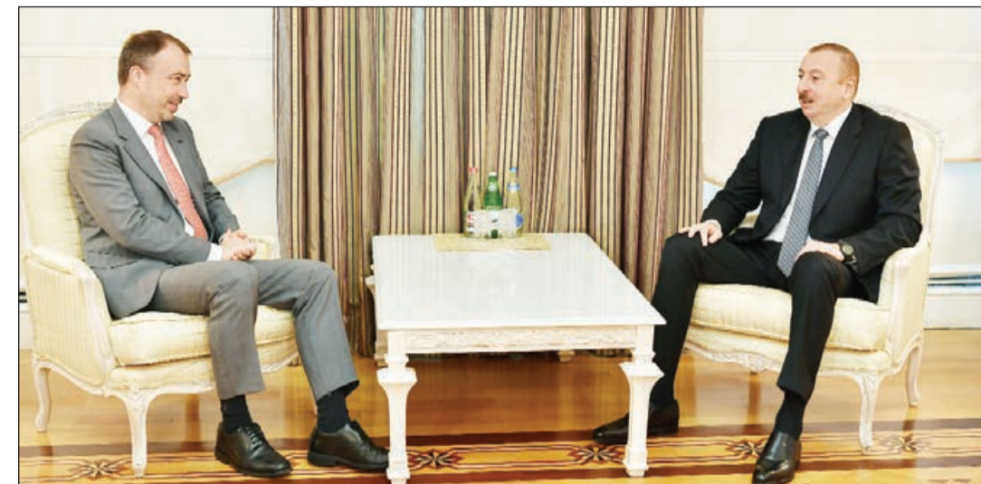
Azərbaycan Respublikasının Prezidenti İlham Əliyev oktyabrın 30-da Avropa İttifaqının Cənubi Qafqaz və Gürcüstan böhranı üzrə xüsusi nümayəndəsi Toivo Klaarinin başçılıq etdiyi nümayəndə heyətini qəbul edib.

AZƏRTAC xəbər verir ki, görüşdə dövlət başçısı Ermənistan-Azərbaycan Dağlıq Qarabağ münaqişəsi ilə bağlı Azərbaycanın mövqeyini bir daha diqqətə çatdıraraq münaqişənin yalnız Azərbaycanın ərazi bütövlüyü çərçivəsində həll edilməli olduğunu vurğuladı. Söhbət zamanı Azərbaycan-Avropa İttifaqı əlaqələri haqqında fikir mübadiləsi aparıldı.